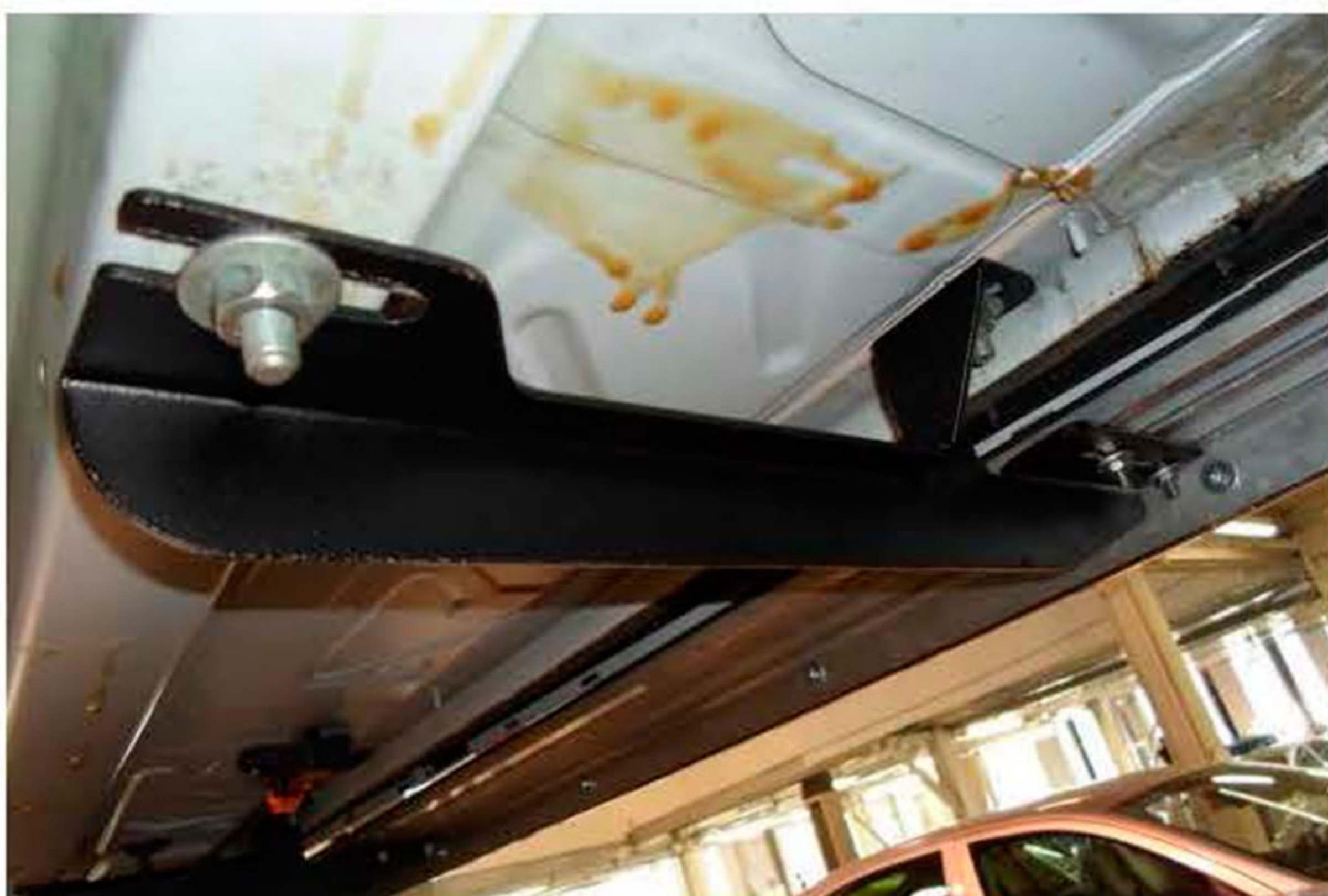
Рис.2 Установка переднего кронштейна