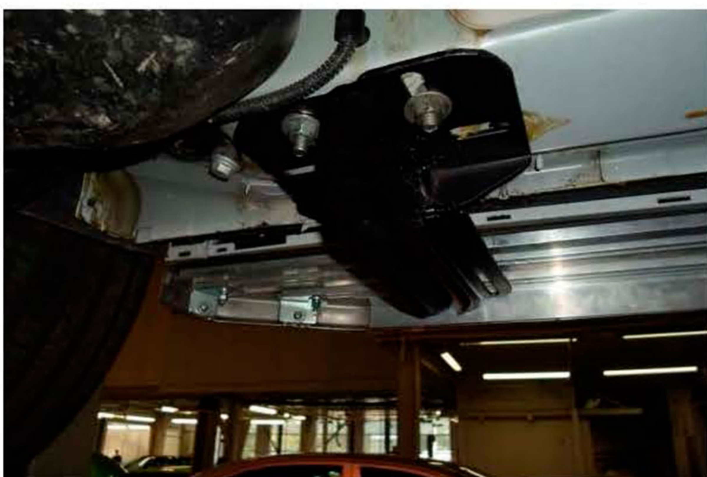
Рис.4 Установка переднего кронштейна