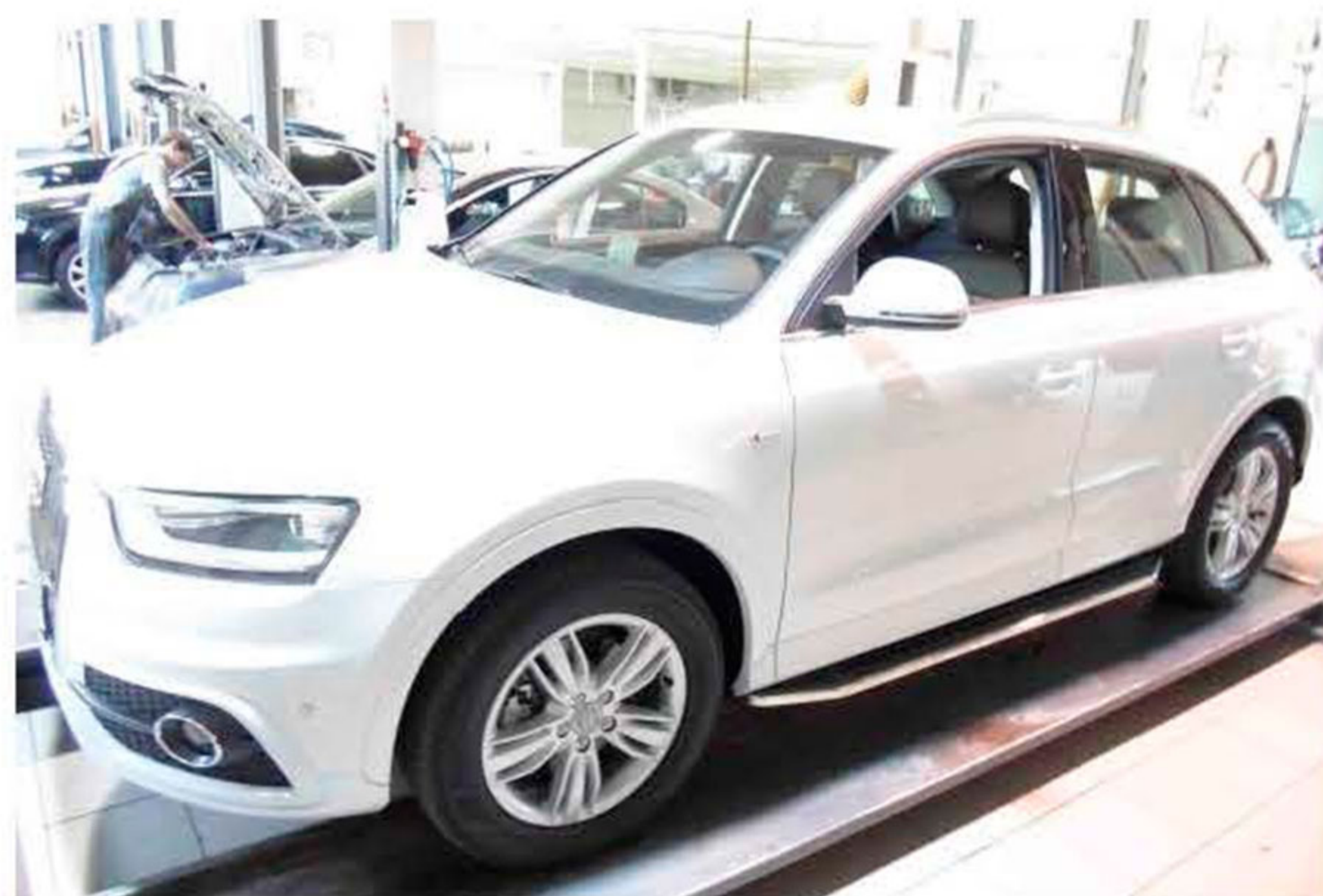
Рис.5 Вид автомобиля с порогом