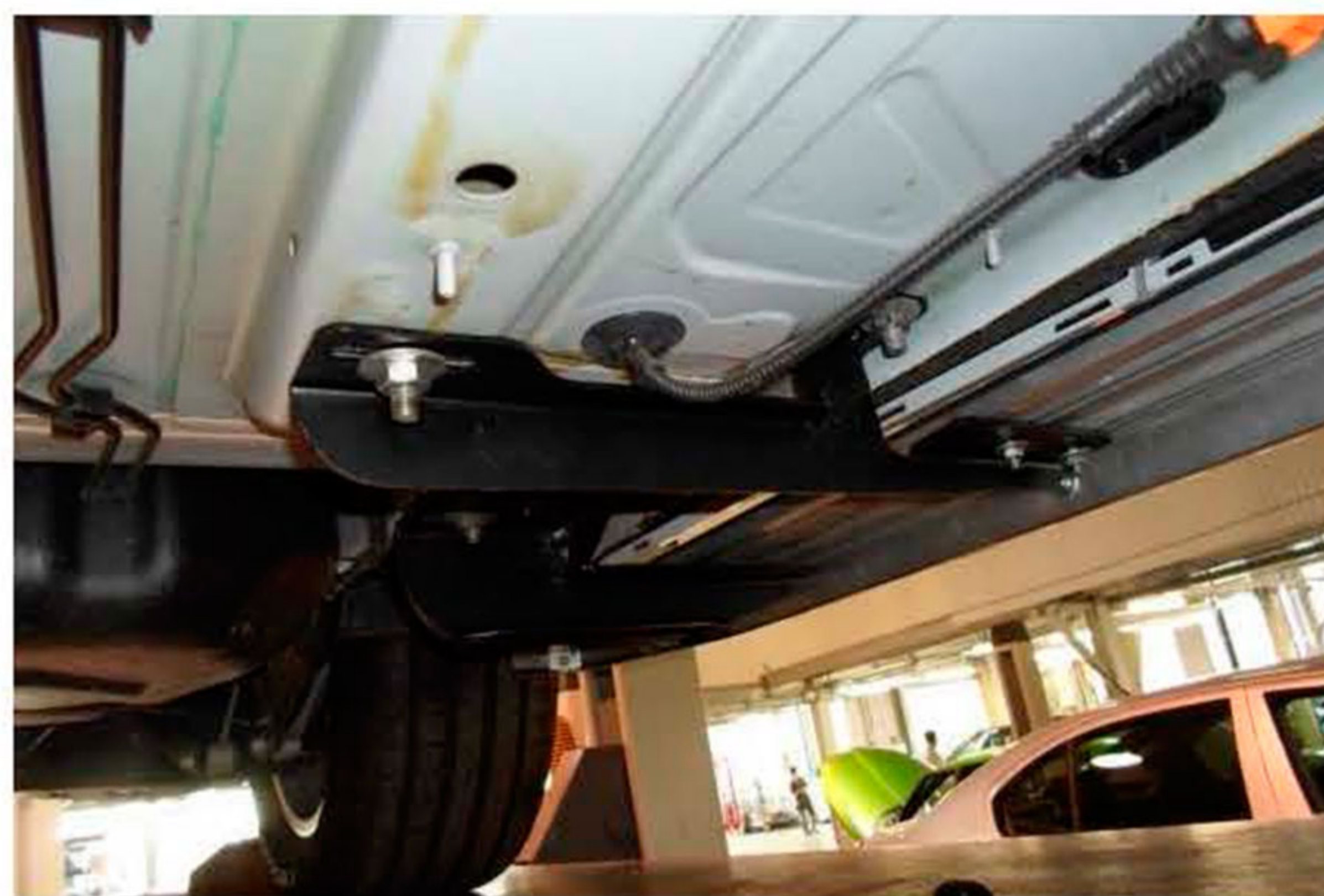
Рис.3 Установка переднего кронштейна