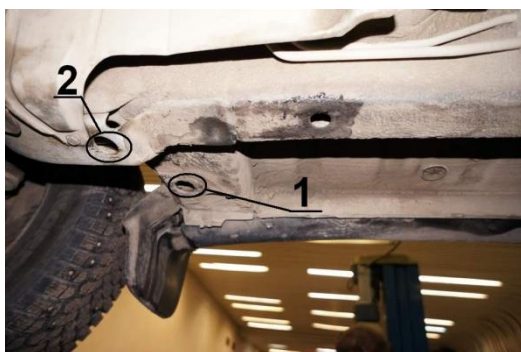
Рис.2 Место установки переднего кронштейна