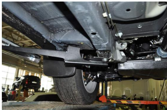
Рис.4 Установка переднего кронштейна