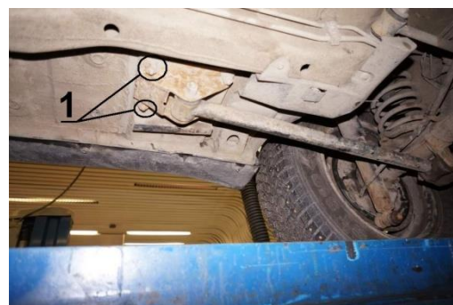
Рис.3 Место установки заднего кронштейна