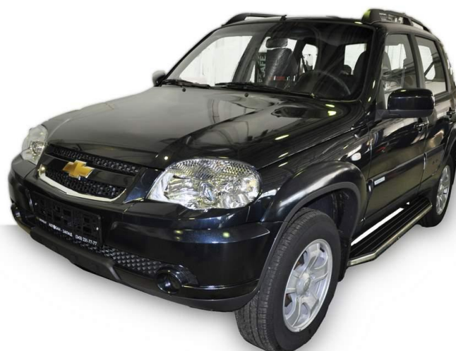
Рис.6 Вид автомобиля с порогом