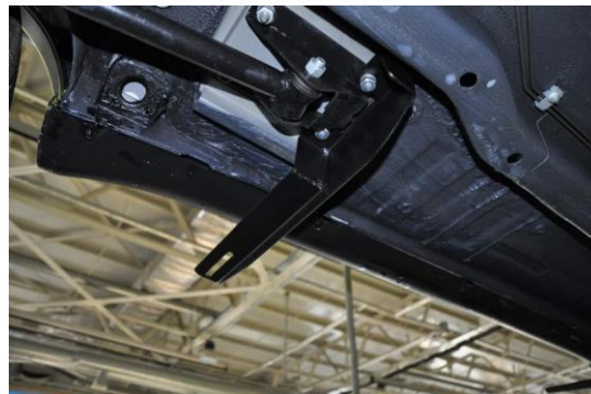
Рис.5 Установка заднего кронштейна