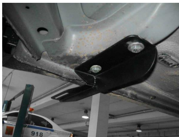
Рис.3 Установка переднего кронштейна