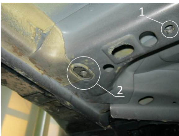
Рис.2 Место крепления переднего кронштейна.