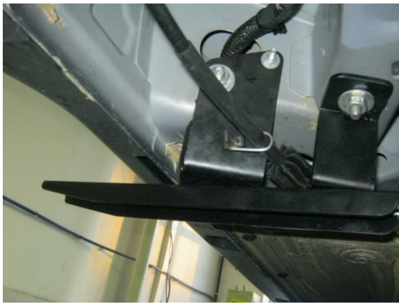
Рис.6 Установка заднего кронштейна.