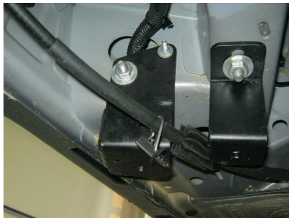
Рис.5 Установка креплений для заднего кронштейна.