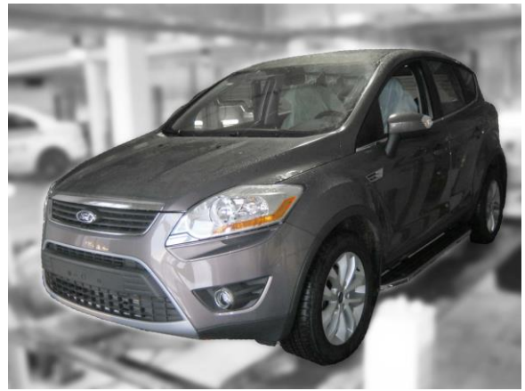
Рис.5 Вид автомобиля с порогом