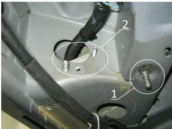
Рис.4 Место крепления заднего кронштейна.