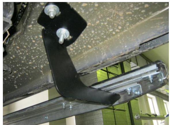
Рис.5 Установка заднего кронштейна.