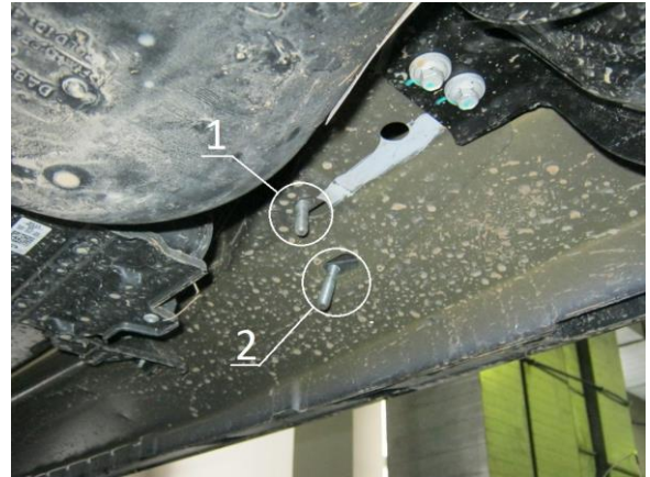
Рис.3 Место крепления заднего кронштейна.