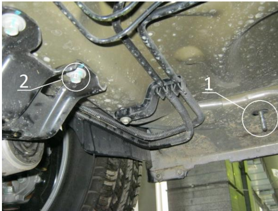
Рис.2 Место крепления переднего кронштейна.