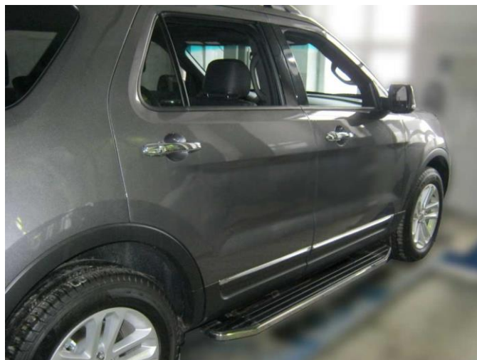
Рис.5 Вид автомобиля с порогом