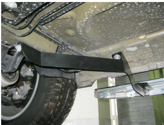
Рис.4 Установка переднего кронштейна.