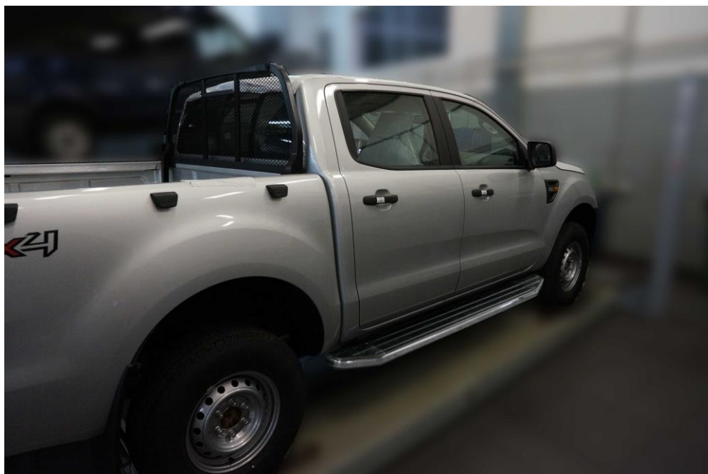
Рис.5 Вид автомобиля с порогом