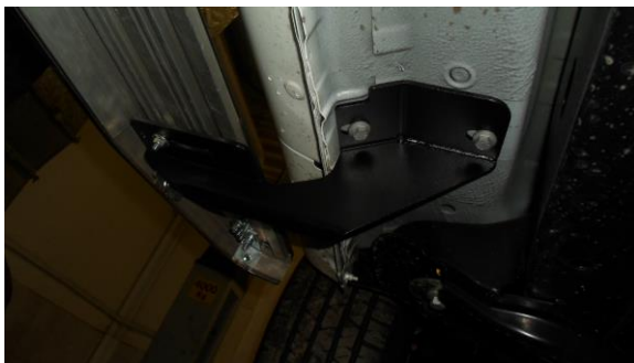
Рис.2 Установка переднего кронштейна в передней части порога автомобиля.