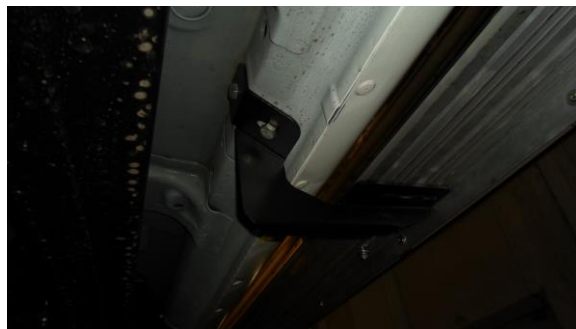
Рис.3 Установка заднего кронштейна в средней части порога автомобиля.