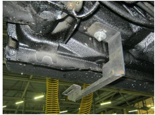
Рис.7 Установка заднего кронштейна