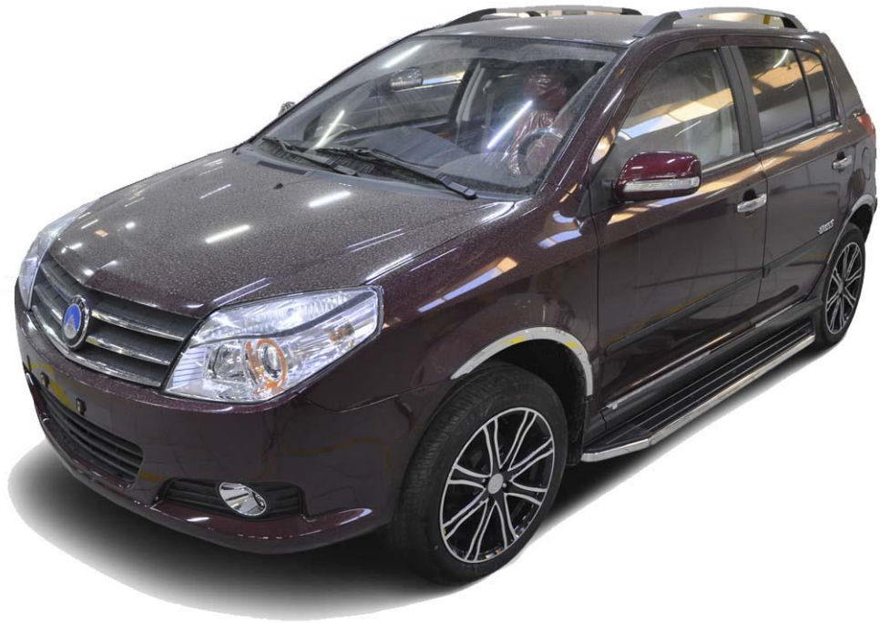
Рис.8 Вид автомобиля с порогом