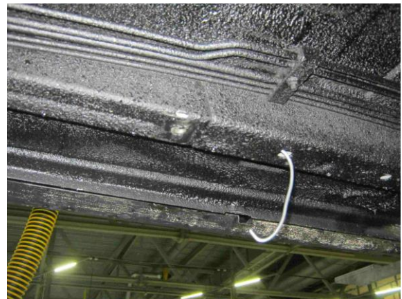
Рис.3 Установка гайки закладной М10 в месте установки среднего кронштейна