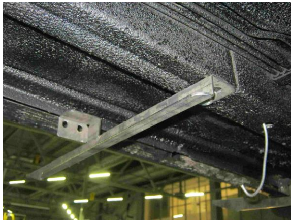
Рис.6 Установка среднего кронштейна