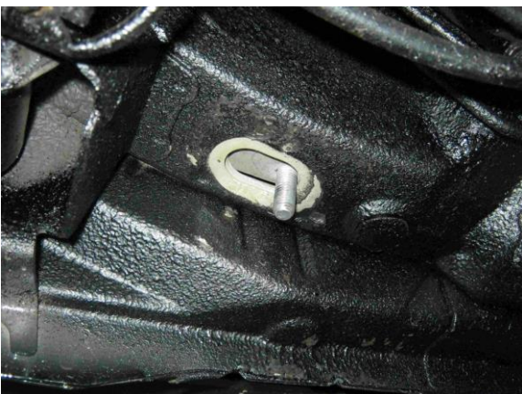
Рис.4 Установка шпильки закладной М10 в месте установки заднего кронштейна