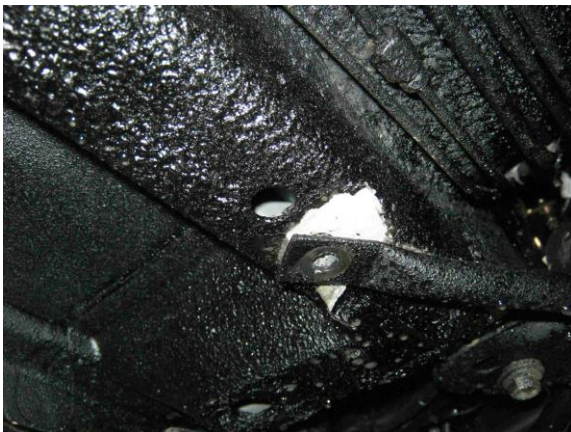
Рис.2 Рычаг автомобиля в месте крепления переднего кронштейна