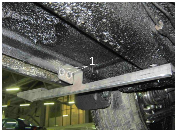
Рис.5 Установка переднего кронштейна