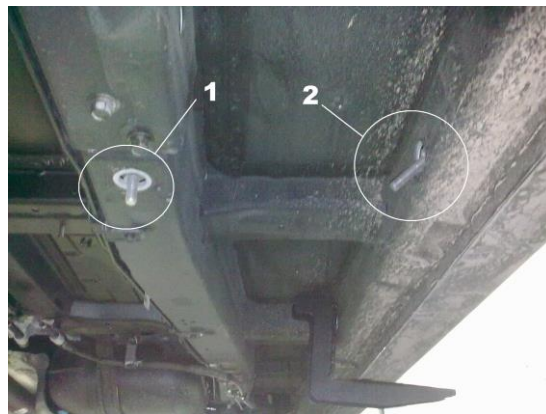
Рис.3 Установка закладных для переднего кронштейна