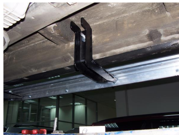
Рис.7 Установка среднего кронштейна