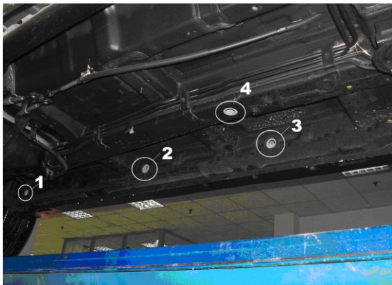
Рис.2 Места крепления кронштейнов