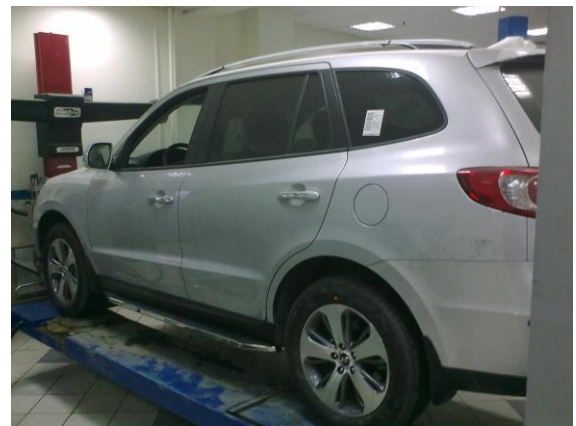
Рис.11 Вид автомобиля с порогом