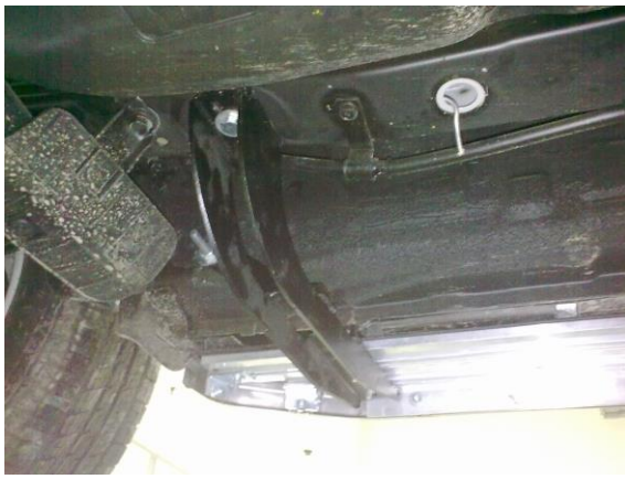
Рис.8 Установка заднего кронштейна