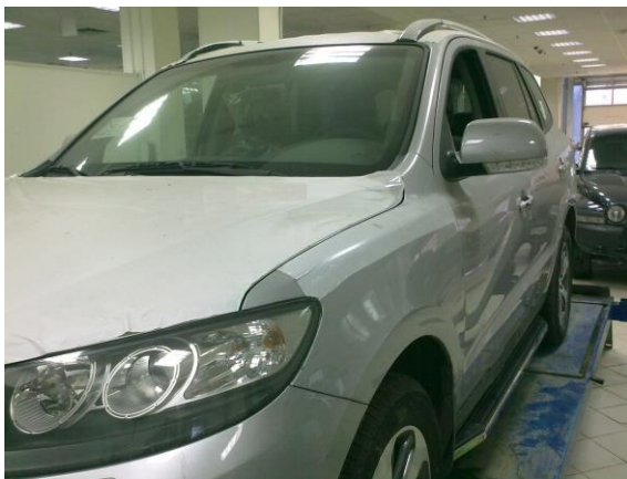
Рис.10 Вид автомобиля с порогом