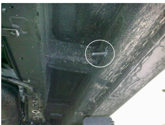
Рис.4 Установка закладной для среднего кронштейна