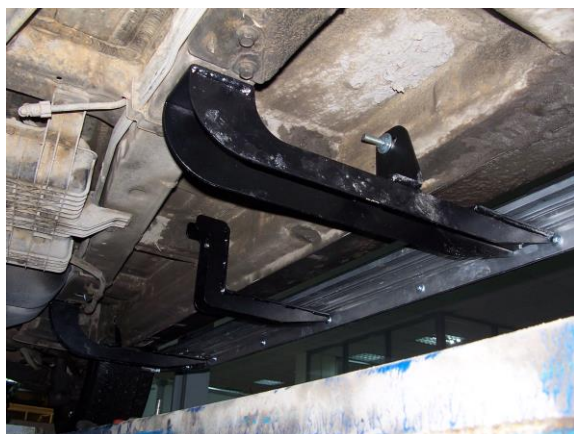
Рис.6 Установка переднего кронштейна