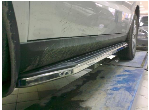
Рис.9 Установка порога