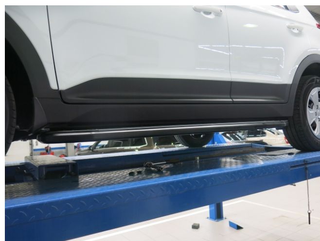
Общий вид автомобиля с порогами