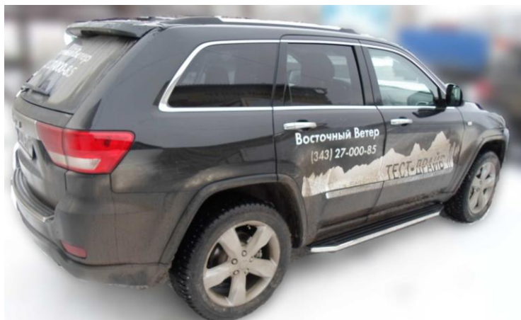
Рис.4 Вид автомобиля с порогом