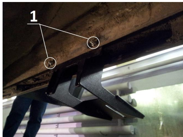
Рис.3 Установка кронштейна