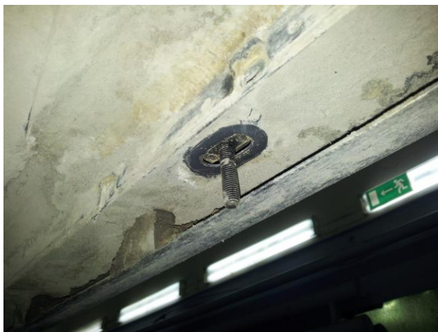
Рис.2 Установка шпильки закладной М10

3. Затянуть все резьбовые соединения. (М10-50 Нм; М8-30 Нм; М6-10 Нм).