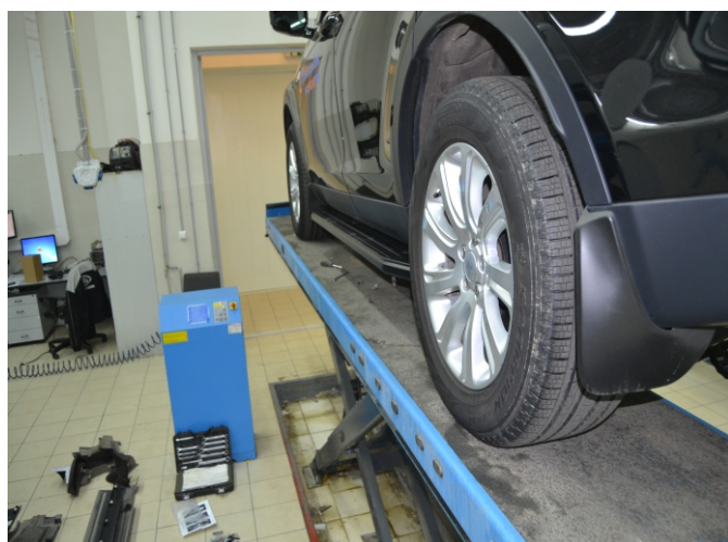
Общий вид автомобиля с порогами

Перед установкой изделия необходимо убедиться, что автомобиль, на который планируется установка, соответствует модельному ряду, указанному в настоящей инструкции. В случае затруднений с определением соответствия обращайтесь службу технической поддержки supp@rivalauto.com . В случае наезда на препятствие необходимо убедиться в отсутствии повреждений и агрегатов автомобиля и пригодности дальнейшей эксплуатации порогов. При правильной установке пороги не должны касаться узлов и агрегатов автомобиля. Производитель вправе вносить изменения в конструкцию порогов.