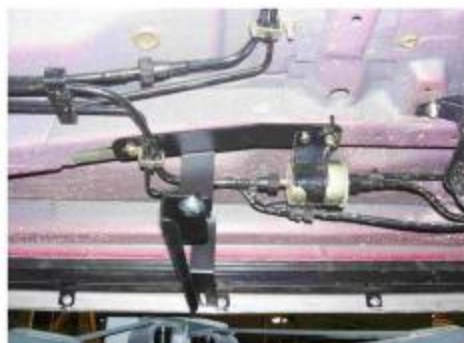
Рис.5 Установка среднего кронштейна