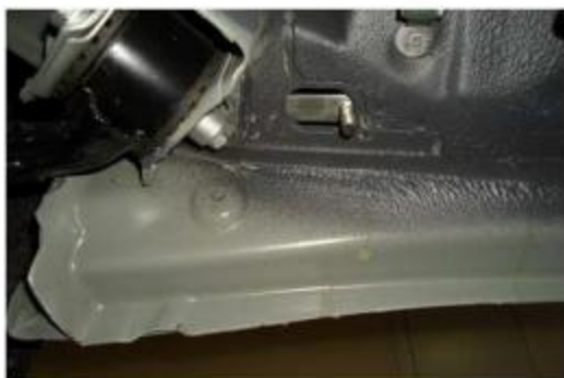
Рис.6 Установка шпильки закладной M10