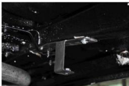
Рис.4 Установка крепления 2