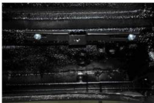
Рис.2 Установка крепления 1