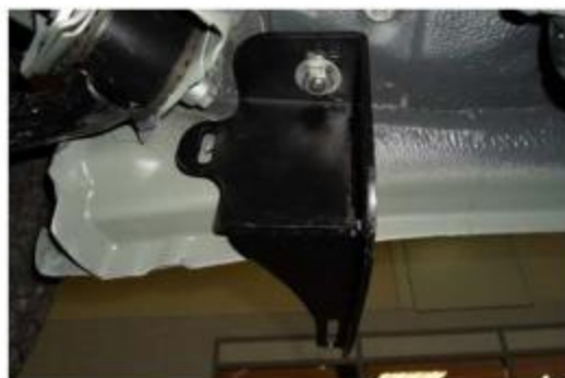
Рис.7 Установка заднего кронштейна