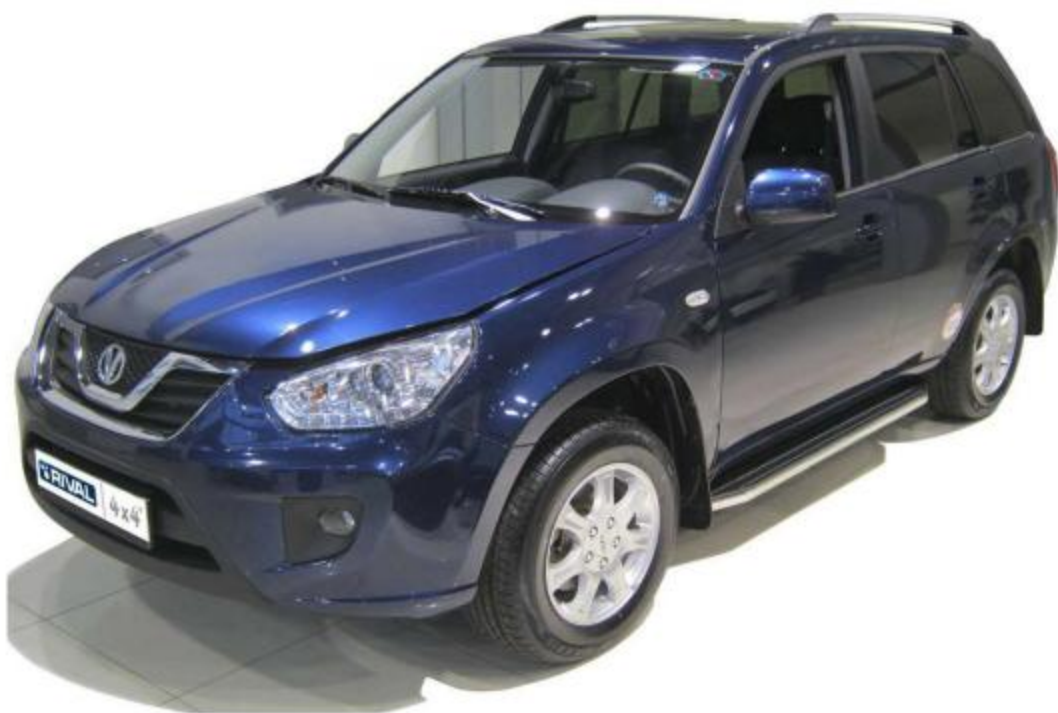
Рис.8 Вид автомобиля с порогом