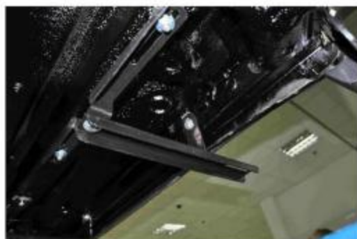
Рис.3 Установка переднего кронштейна