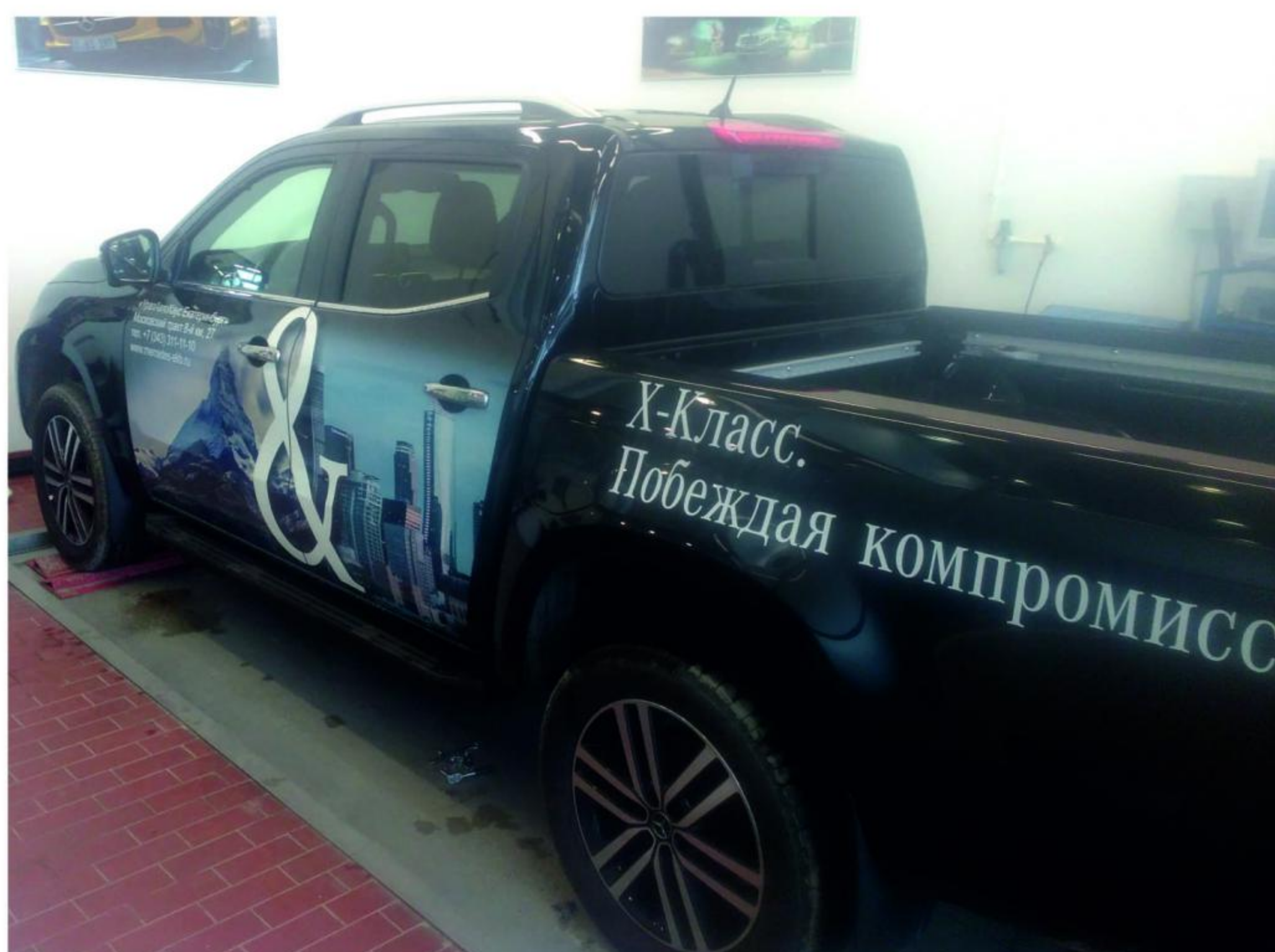
Общий вид автомобиля с порогом

Перед установкой изделия необходимо убедиться, что автомобиль, на который планируется установка, соответствует модельному ряду, указанному в настоящей инструкции. В случае затруднений с определением соответствия обращайтесь службу технической поддержки supp@rivalauto.com . В случае наезда на препятствие необходимо убедиться в отсутствии повреждений и агрегатов автомобиля и пригодности дальнейшей эксплуатации порогов. При правильной установке пороги не должны касаться узлов и агрегатов автомобиля. Производитель вправе вносить изменения в конструкцию порогов.