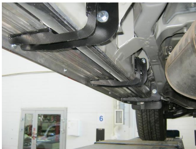
Рис. 5 Общий вид установленных кронштейнов