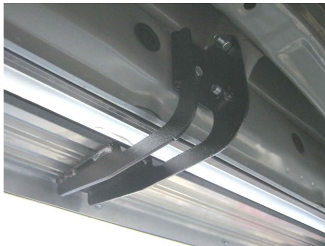
Рис. 3 Средний кронштейн