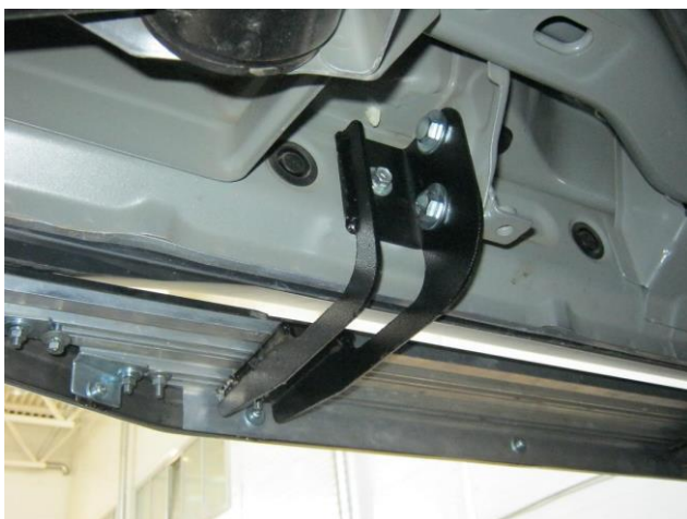
Рис. 4 Задний кронштейн