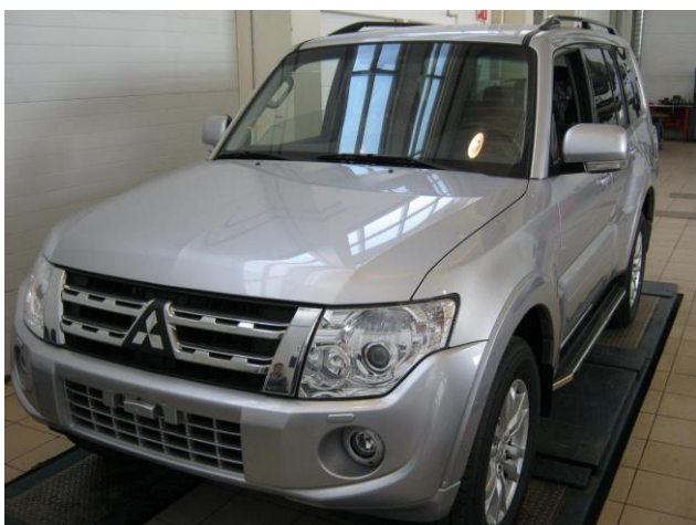
Рис. 6 Вид автомобиля с порогом