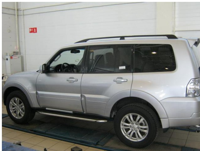
Рис. 7 Вид автомобиля с порогом