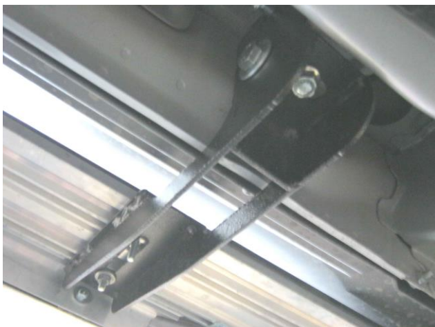
Рис. 2 Передний кронштейн