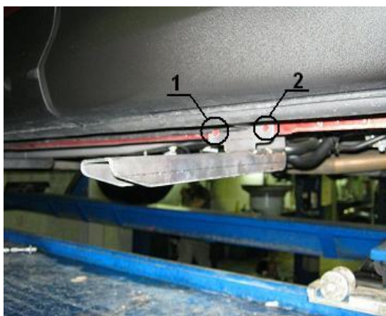
Рис. 4 Места для сверления отверстий