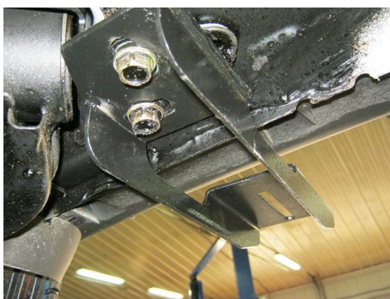
Рис. 6 Установка заднего кронштейна