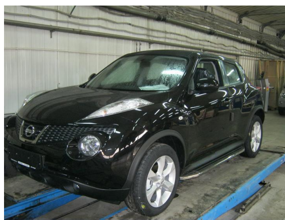
Рис. 7 Вид автомобиля с порогом