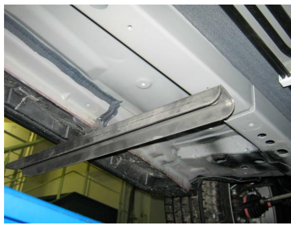
Рис. 5 Установка переднего кронштейна