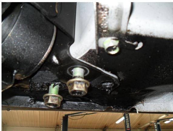
Рис. 2 Место крепления заднего кронштейна