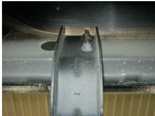
Рис. 3 Установка кронштейна