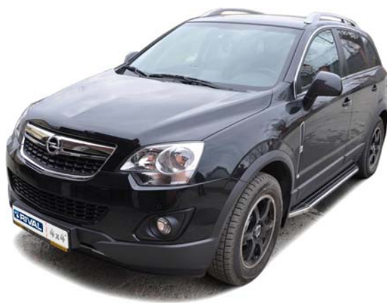
Рис.4 Вид автомобиля с порогом