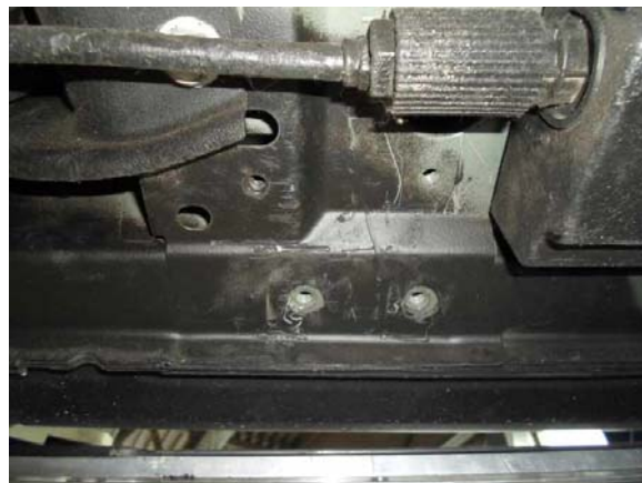
Рис.3 Место установки заднего кронштейна