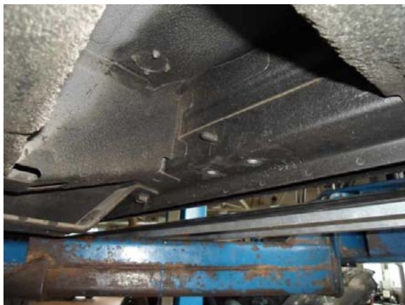
Рис.2 Место установки переднего кронштейна