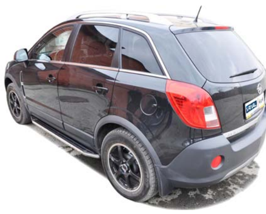
Рис.5 Вид автомобиля с порогом