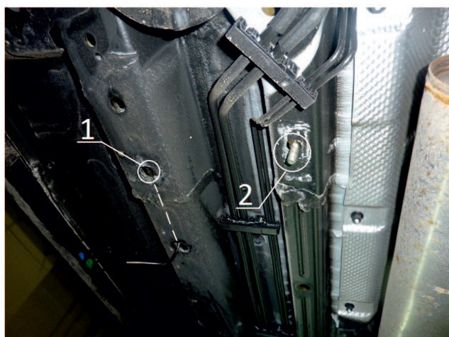
Рис. 1 - Место установки переднего кронштейна