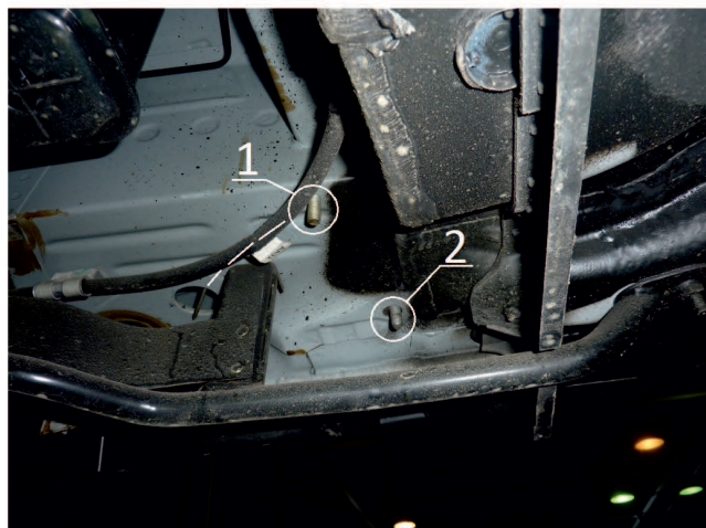
Рис. 5 - Место установки заднего кронштейна