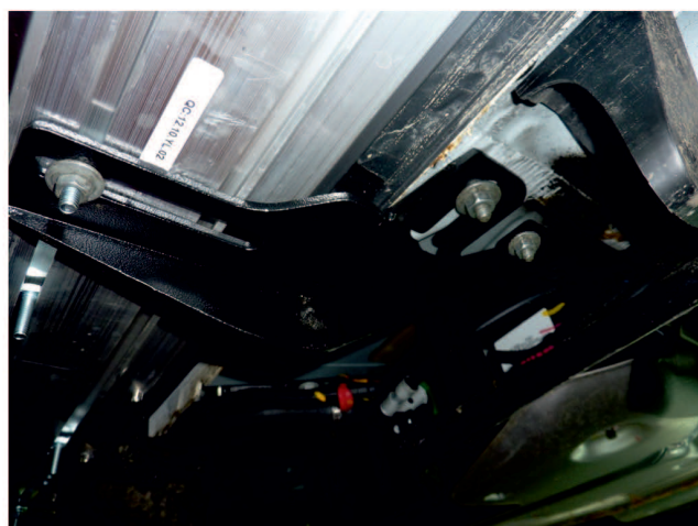
Рис. 6 - Установка заднего кронштейна