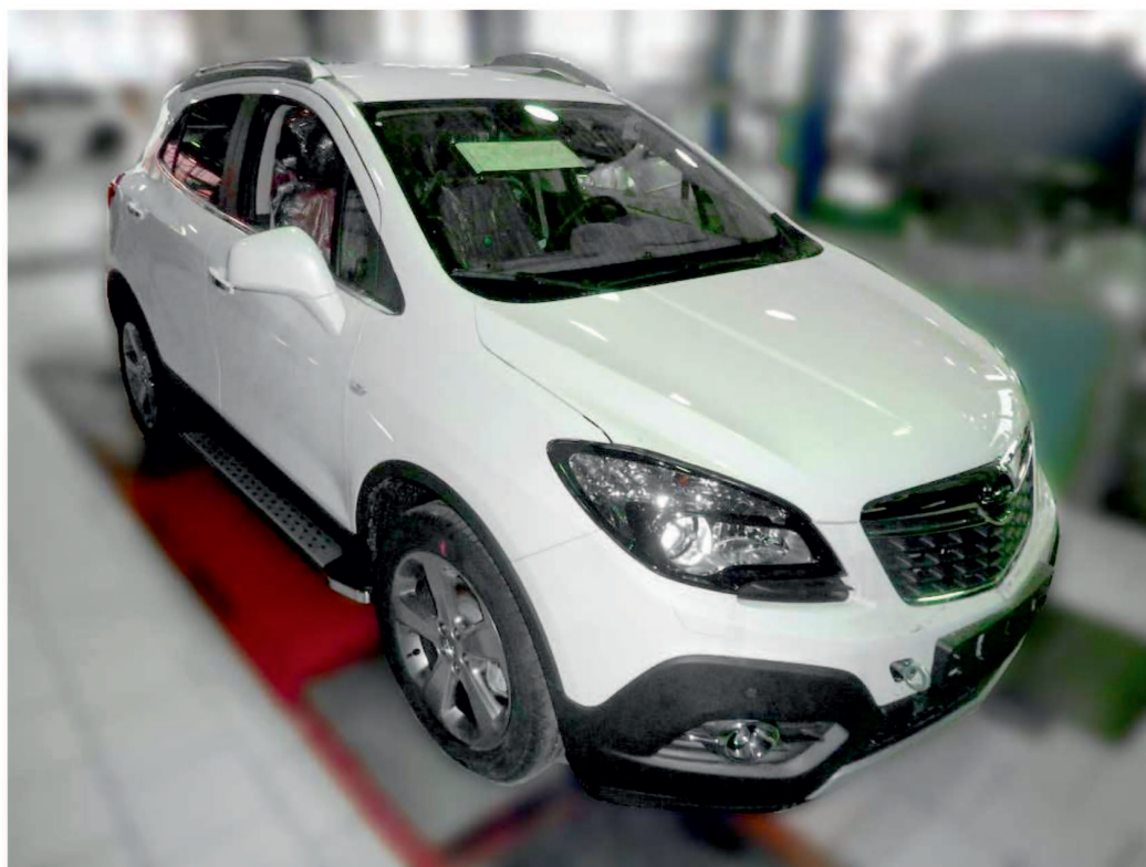
Рис. 7 - Общий вид автомобиля с порогом