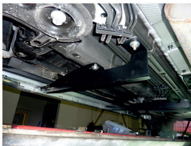
Рис. 2 - Установка переднего кронштейна