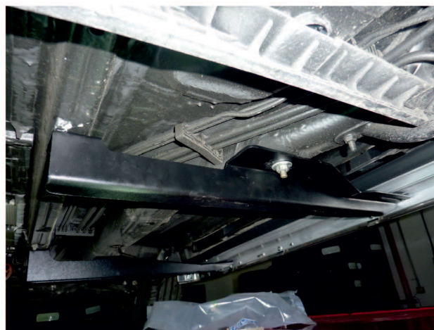
Рис. 4 - Установка среднего кронштейна