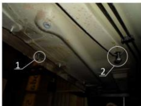
Рис.4 Место установки среднего кронштейна.