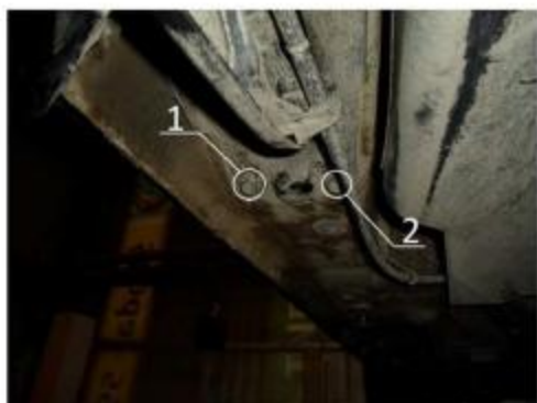
Рис.6 Место установки заднего кронштейна.