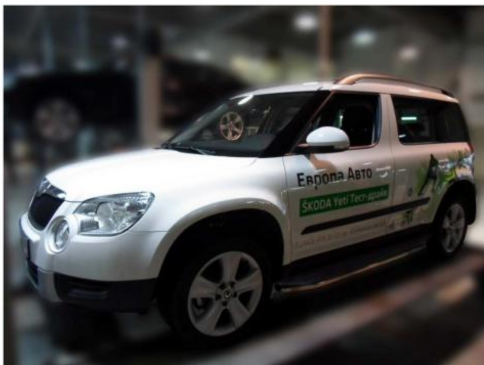
Рис.8 Вид автомобиля с порогом