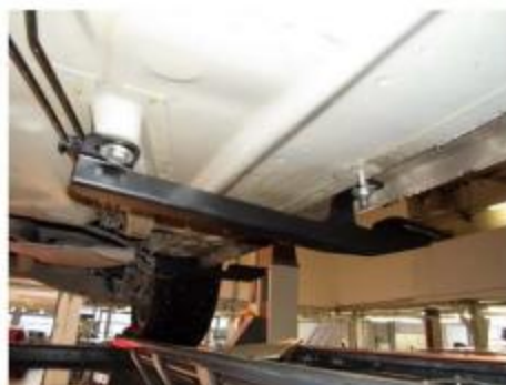
Рис.5 Установка среднего кронштейна