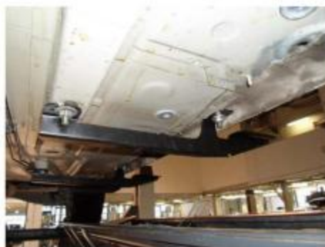
Рис.3 Установка переднего кронштейна.