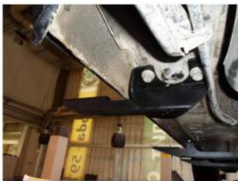
Рис.7 Установка заднего кронштейна.