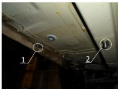
Рис.2 Место установки переднего кронштейна.