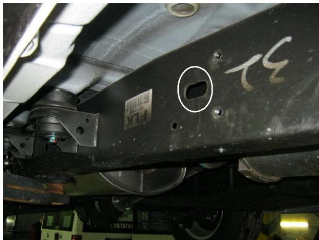
Рис. 5 Место крепления среднего кронштейна