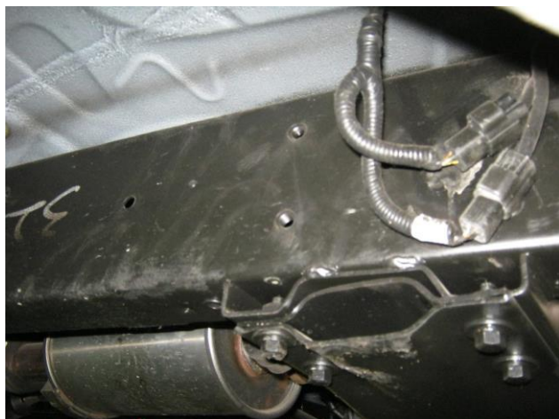
Рис. 2 Место крепления переднего кронштейна справа