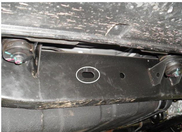
Рис. 6 Место крепления заднего кронштейна