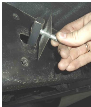
Рис. 7 Установка шпильки закладной М10