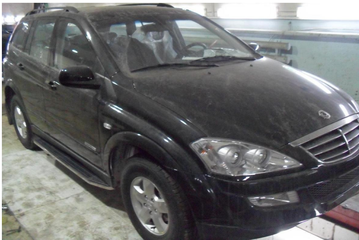
Рис. 10 Вид автомобиля с порогом