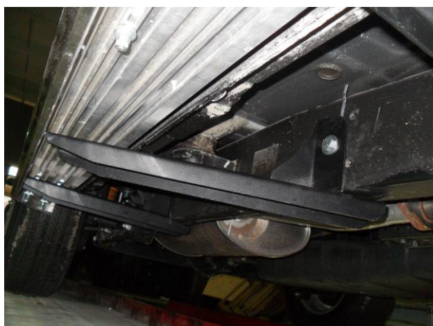
Рис. 8 Крепление среднего кронштейна