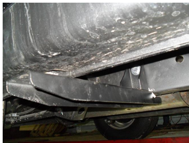
Рис. 9 Крепление заднего кронштейна