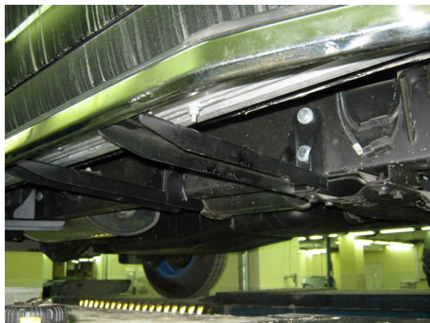
Рис. 3 Установка переднего кронштейна