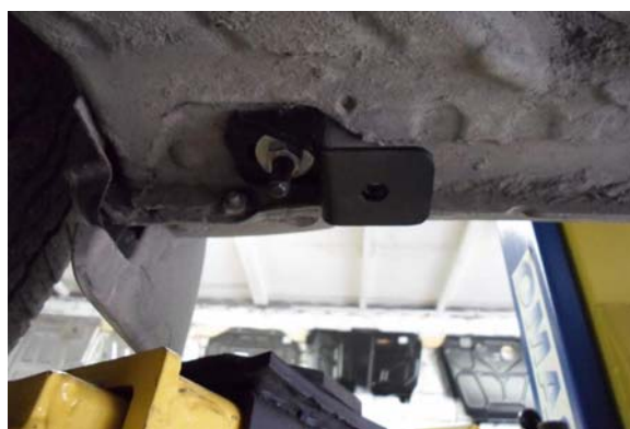
Рис.3 Крепление упора