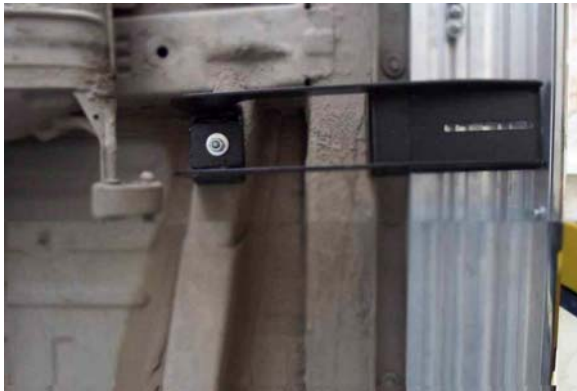
Рис.6 Установка среднего кронштейна