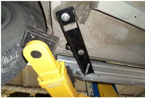
Рис.4 Крепление переднего кронштейна