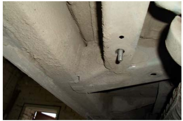
Рис.5 Место крепления среднего кронштейна