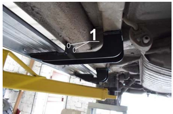
Рис.7 Разметка крепёжных отверстий