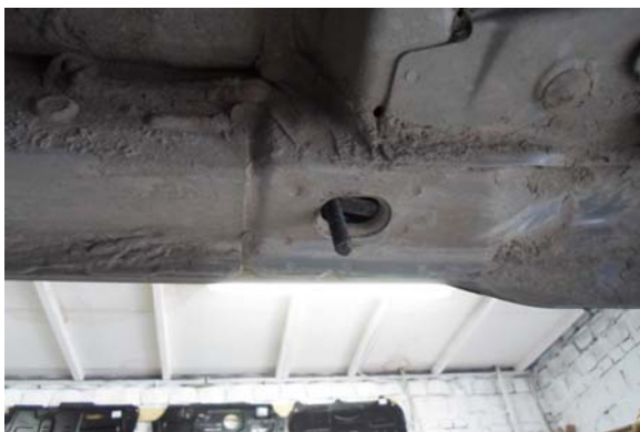
Рис.8 Место крепления заднего кронштейна