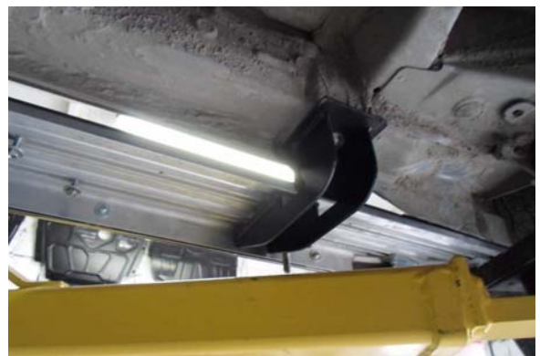
Рис.9 Установка заднего кронштейна