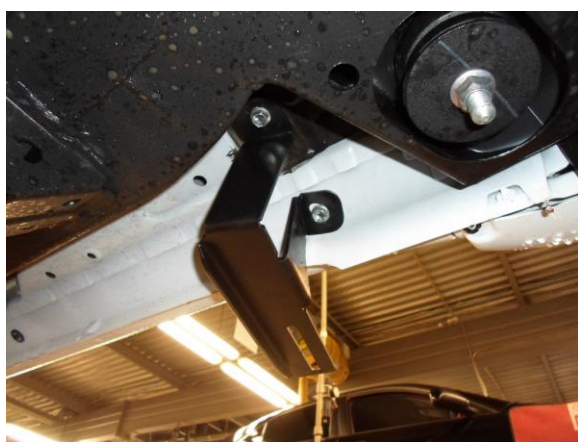
Рис.2 Установка кронштейна в передней части порога автомобиля.