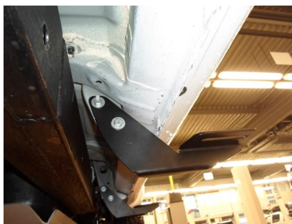
Рис.3 Установка кронштейна в средней части порога автомобиля.