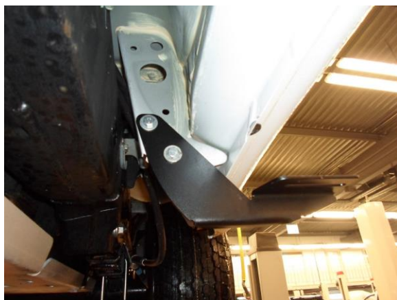
Рис.4 Установка кронштейна в задней части порога автомобиля.