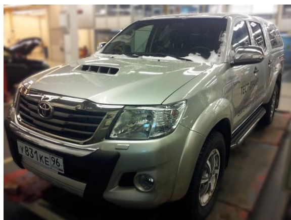
Рис.5 Вид автомобиля с порогом