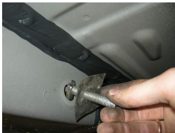
Рис.3 Установка шпильки закладной М10х48