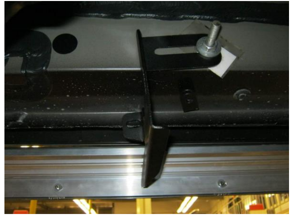
Рис.5 Установка среднего кронштейна