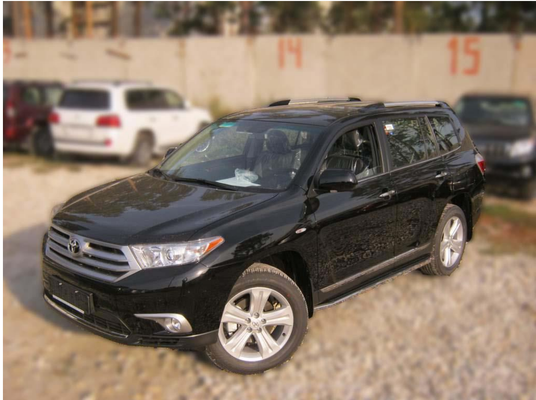
Рис.8 Вид автомобиля с порогом