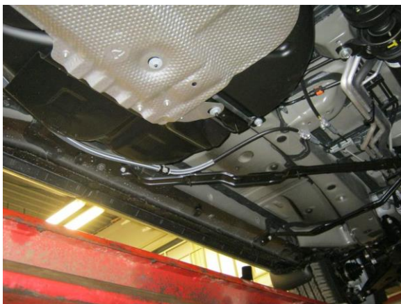
Рис.2 Днище автомобиля со снятыми пыльниками