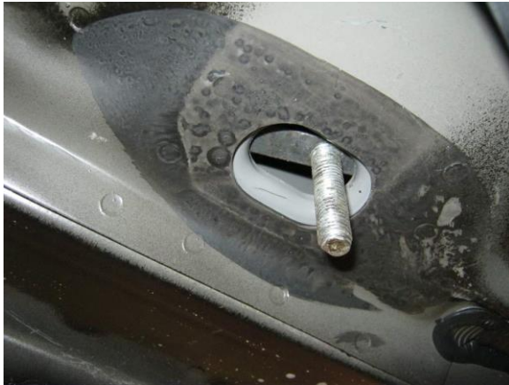
Рис.6 Установка шпильки закладной M10x43