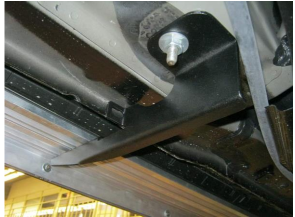
Рис.7 Установка заднего кронштейна