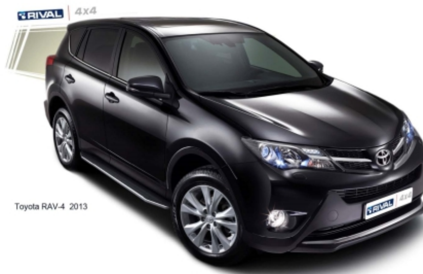
Toyota RAV-4 2013

Перед установкой изделия необходимо убедиться, что автомобиль, на который планируется установка, соответствует модельному ряду, указанному в настоящей инструкции. В случае затруднений с определением соответствия обращайтесь службу технической поддержки supp@rivalauto.com . В случае наезда на препятствие необходимо убедиться в отсутствии повреждений и агрегатов автомобиля и пригодности дальнейшей эксплуатации порогов. При правильной установке пороги не должны касаться узлов и агрегатов автомобиля. Производитель вправе вносить изменения в конструкцию порогов.