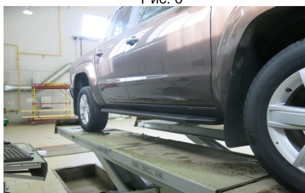
Общий вид автомобиля с порогом

Перед установкой изделия необходимо убедиться, что автомобиль, на который планируется установка, соответствует модельному ряду, указанному в настоящей инструкции. В случае затруднений с определением соответствия обращайтесь службу технической поддержки supp@rivalauto.com . В случае наезда на препятствие необходимо убедиться в отсутствии повреждений и агрегатов автомобиля и пригодности дальнейшей эксплуатации порогов. При правильной установке пороги не должны касаться узлов и агрегатов автомобиля. Производитель вправе вносить изменения в конструкцию порогов.