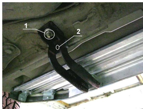
Рис.3 Установка заднего кронштейна