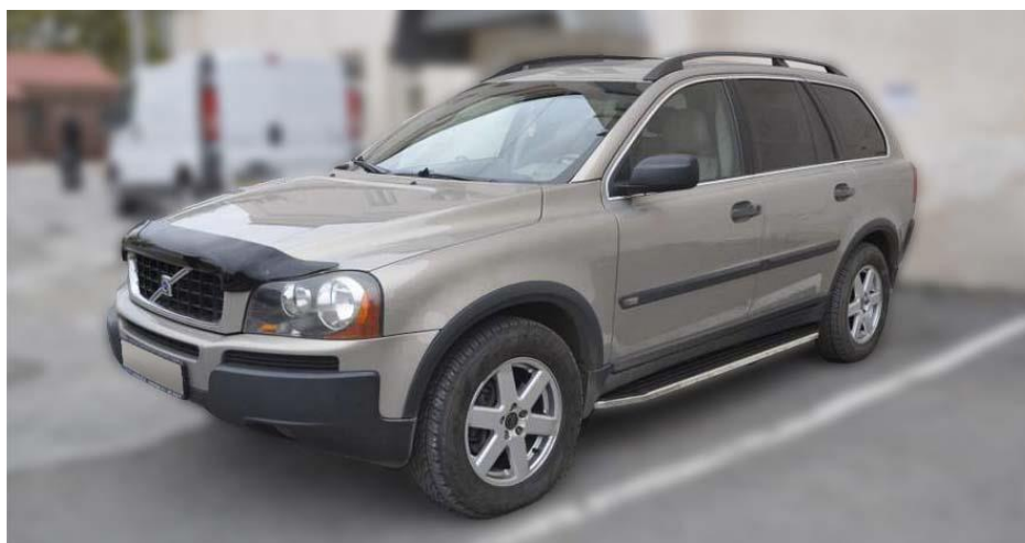
Рис.4 Вид автомобиля с порогом