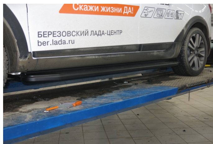
Общий вид автомобиля с порогом