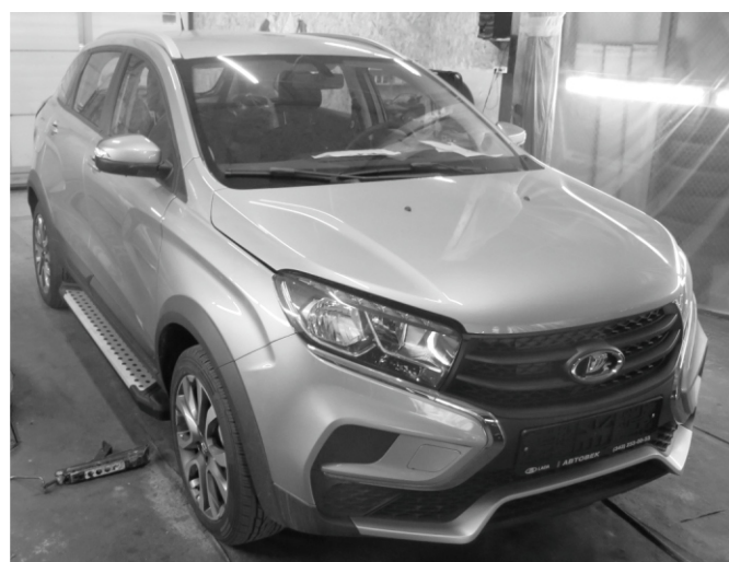
Общий вид автомобиля с порогом

Перед установкой изделия необходимо убедиться, что автомобиль, на который планируется установка, соответствует модельному ряду, указанному в настоящей инструкции. В случае затруднений с определением соответствия обращайтесь службу технической поддержки supp@rivalauto.com . В случае наезда на препятствие необходимо убедиться в отсутствии повреждений и агрегатов автомобиля и пригодности дальнейшей эксплуатации порогов. При правильной установке пороги не должны касаться узлов и агрегатов автомобиля. Производитель вправе вносить изменения в конструкцию порогов.