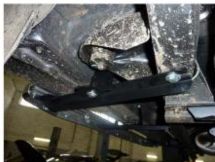
Рис.5 Установка переднего кронштейна