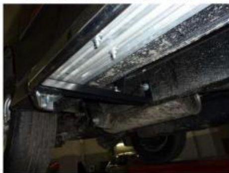
Рис.9 Установка среднего и заднего кронштейнов