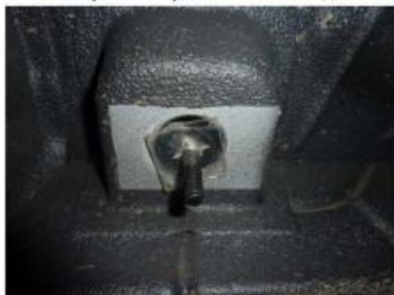
Рис.2 Установка шпильки закладной M10x43x70/25 в месте установки переднего крепления