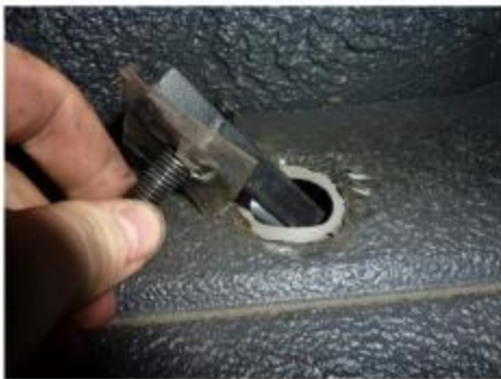
Рис.6 Установка шпильки закладной M10x43x70/18 в месте установки среднего и заднего креплений