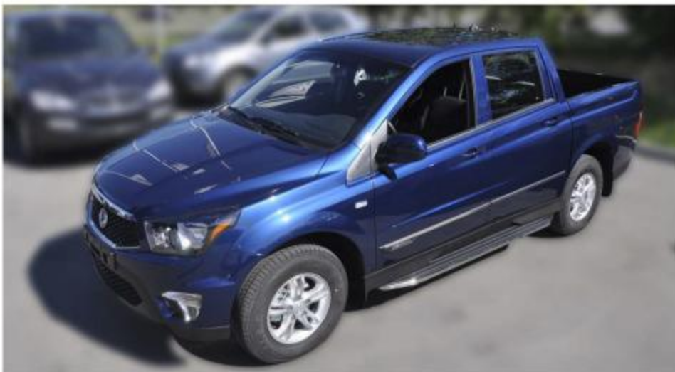
Рис.10 Вид автомобиля с порогом