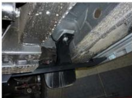
Рис.4 Установка переднего крепления