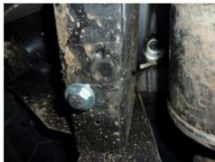
Рис.3 Установка гайки закладной M10 в месте установки переднего кронштейна