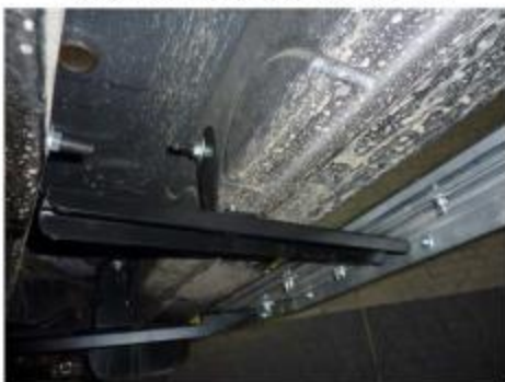
Рис.8 Установка среднего и заднего креплений