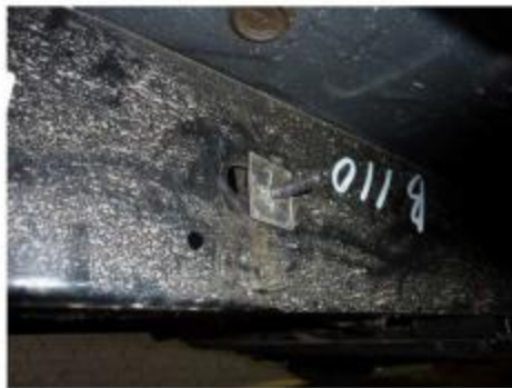
Рис.7 Установка шпильки закладной M10x43x90/20 в месте установки среднего и заднего кронштейна