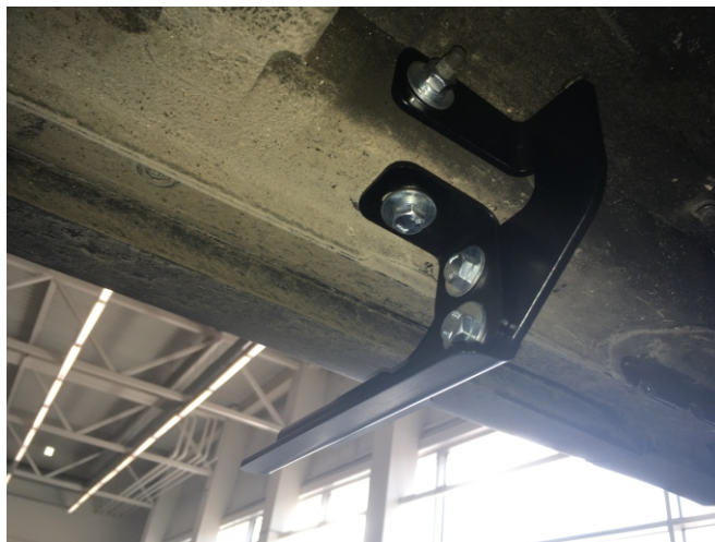
Рис. 1 - Установка переднего кронштейна