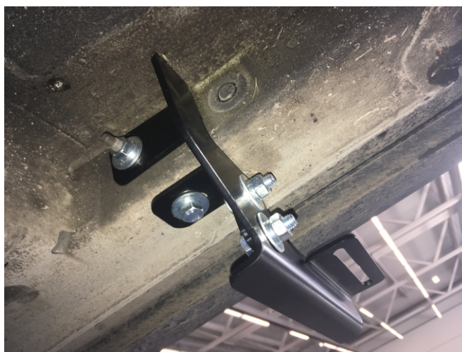
Рис. 2 - Установка среднего заднего кронштейна