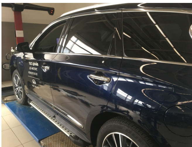
Вид автомобиля с порогом

Перед установкой изделия необходимо убедиться, что автомобиль, на который планируется установка, соответствует модельному ряду, указанному в настоящей инструкции. В случае затруднений с определением соответствия обращайтесь службу технической поддержки supp@rivalauto.com . В случае наезда на препятствие необходимо убедиться в отсутствии повреждений и агрегатов автомобиля и пригодности дальнейшей эксплуатации порогов. При правильной установке пороги не должны касаться узлов и агрегатов автомобиля. Производитель вправе вносить изменения в конструкцию порогов.