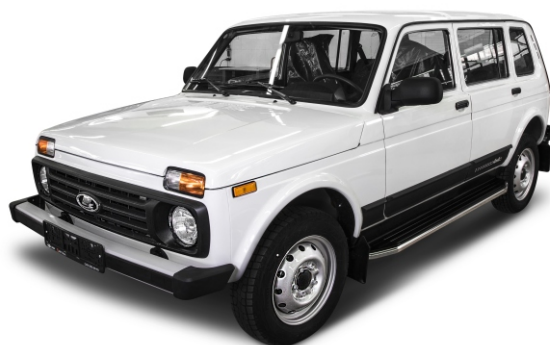
Общий вид автомобиля с порогом

Перед установкой изделия необходимо убедиться, что автомобиль, на который планируется установка, соответствует модельному ряду, указанному в настоящей инструкции. В случае затруднений с определением соответствия обращайтесь службу технической поддержки supp@rivalauto.com . В случае наезда на препятствие необходимо убедиться в отсутствии повреждений и агрегатов автомобиля и пригодности дальнейшей эксплуатации порогов. При правильной установке пороги не должны касаться узлов и агрегатов автомобиля. Производитель вправе вносить изменения в конструкцию порогов.