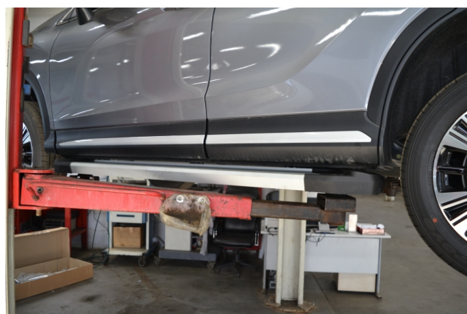
Общий вид автомобиля с порогом

Перед установкой изделия необходимо убедиться, что автомобиль, на который планируется установка, соответствует модельному ряду, указанному в настоящей инструкции. В случае затруднений с определением соответствия обращайтесь службу технической поддержки supp@rivalauto.com . В случае наезда на препятствие необходимо убедиться в отсутствии повреждений и агрегатов автомобиля и пригодности дальнейшей эксплуатации порогов. При правильной установке пороги не должны касаться узлов и агрегатов автомобиля. Производитель вправе вносить изменения в конструкцию порогов.