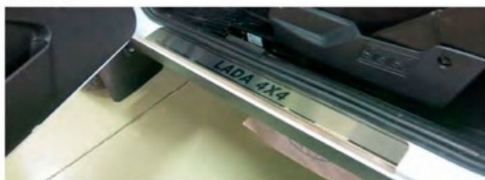
Фото установленной накладки

Накладки на остальные пороги устанавливаются аналогичным образом.