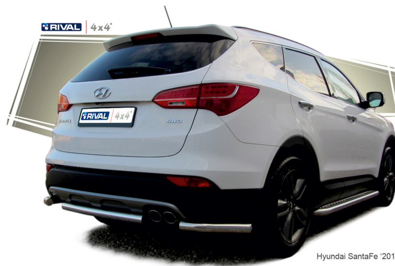
Hyundai SantaFe '2012