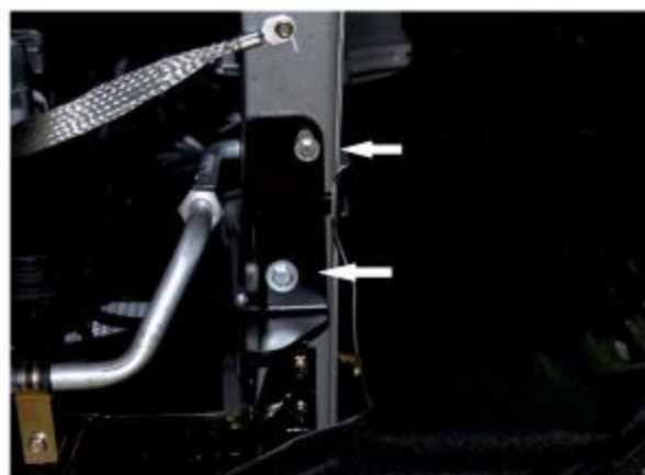
Рис. 3 - Установка кронштейна