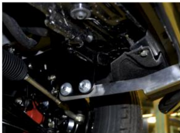
Рис. 4 - Установка защиты переднего бампера