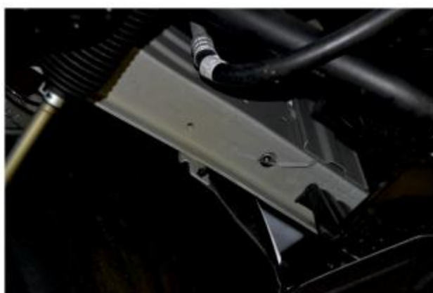
Рис. 2 - Установка закладной гайки