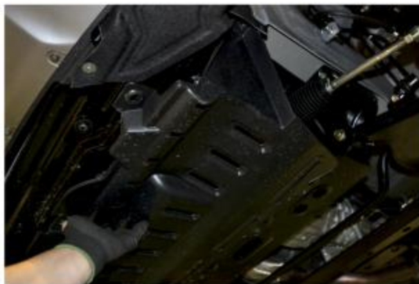
Рис. 1 - Снятие защитного пыльника