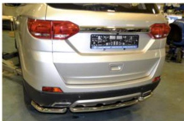
Рис. 4 - Общий вид автомобиля с защитой