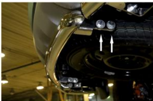
Рис. 3 - Установка защиты