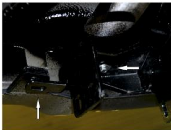
Рис. 2 - Установка кронштейна