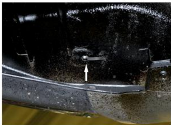
Рис. 1 - Установка закладной гайки