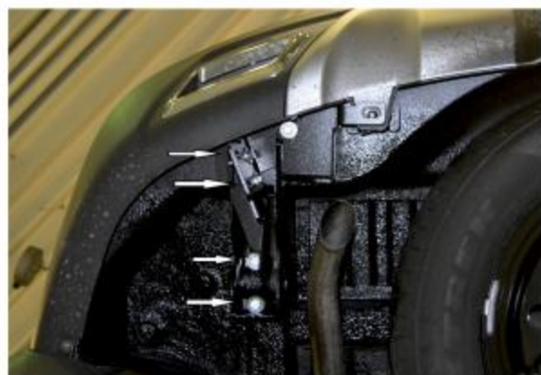
Рис. 3 - Установка кронштейнов 2 и 3