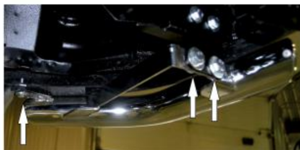
Рис. 4 - Установка защиты