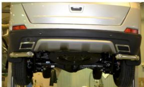
Рис. 4 - Общий вид автомобиля с защитой