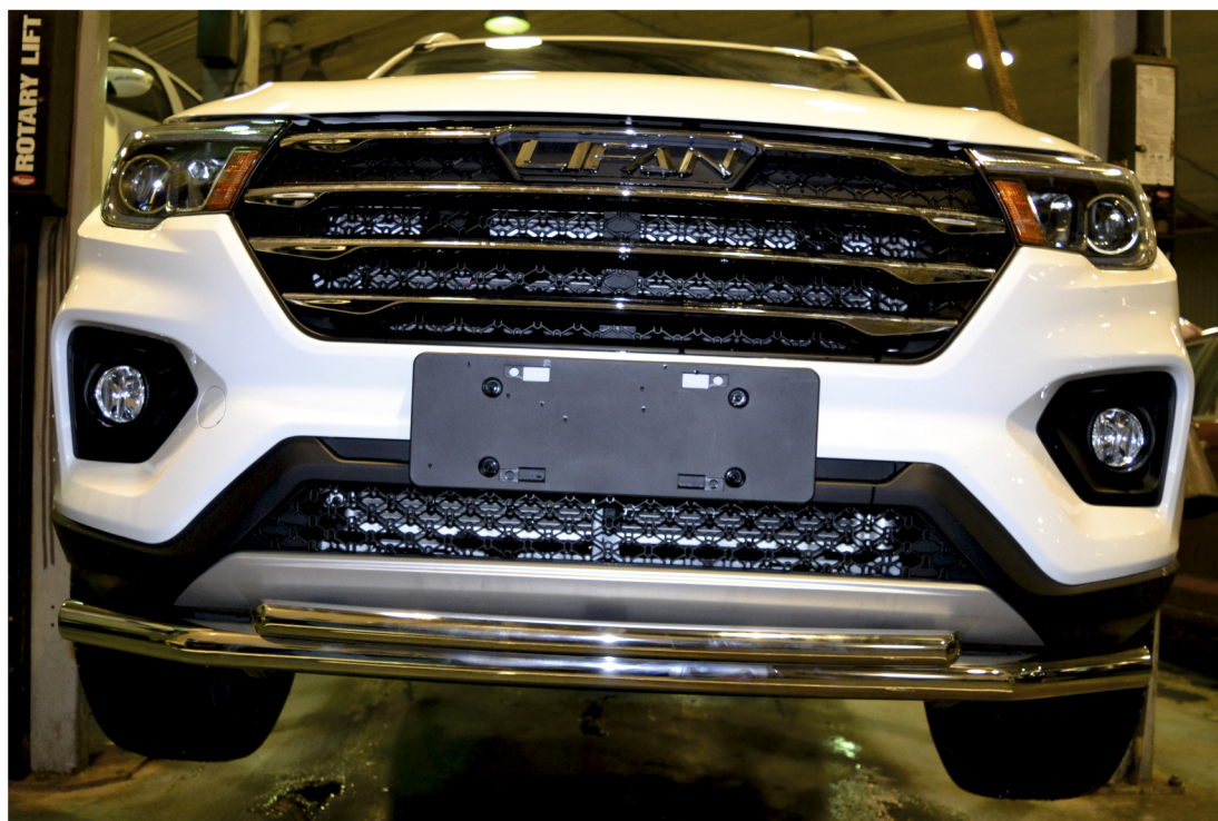
Рис. 3 - Общий вид автомобиля с защитой

Перед установкой изделия необходимо убедиться, что автомобиль, на который планируется установка, соответствует модельному ряду, указанному в настоящей инструкции. В случае затруднений с определением соответствия обращайтесь службу технической поддержки supp@rivalauto.com . В случае наезда на препятствие необходимо убедиться в отсутствии повреждений и агрегатов автомобиля и пригодности дальнейшей эксплуатации порогов. При правильной установке пороги не должны касаться узлов и агрегатов автомобиля. Производитель вправе вносить изменения в конструкцию порогов.