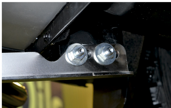
Рис. 2 - Установка защиты