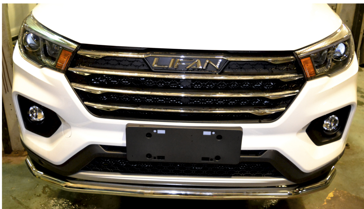
Рис. 3 - Общий вид автомобиля с защитой

Перед установкой изделия необходимо убедиться, что автомобиль, на который планируется установка, соответствует модельному ряду, указанному в настоящей инструкции. В случае затруднений с определением соответствия обращайтесь службу технической поддержки supp@rivalauto.com . В случае наезда на препятствие необходимо убедиться в отсутствии повреждений и агрегатов автомобиля и пригодности дальнейшей эксплуатации защиты. При правильной установке защита не должна касаться узлов и агрегатов автомобиля. Производитель вправе вносить изменения в конструкцию защиты.