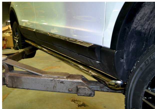
Рис. 4 - Общий вид автомобиля с защитой

Перед установкой изделия необходимо убедиться, что автомобиль, на который планируется установка, соответствует модельному ряду, указанному в настоящей инструкции. В случае затруднений с определением соответствия обращайтесь службу технической поддержки supp@rivalauto.com . В случае наезда на препятствие необходимо убедиться в отсутствии повреждений и агрегатов автомобиля и пригодности дальнейшей эксплуатации защиты. При правильной установке защита не должна касаться узлов и агрегатов автомобиля. Производитель вправе вносить изменения в конструкцию защиты.