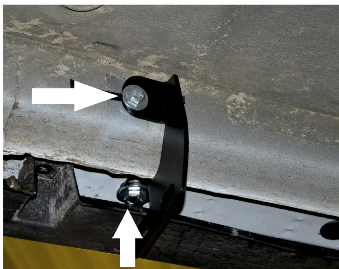
Рис. 1 - Установка переднего кронштейна