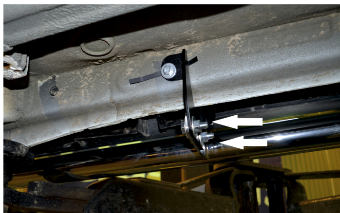
Рис. 3 - Установка защиты