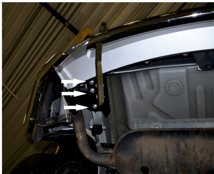
Рис. 1 - Установка левого кронштейна