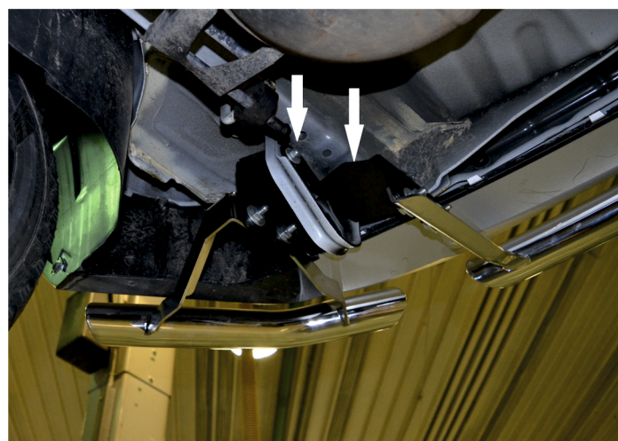
Рис. 2 - Установка правого кронштейна