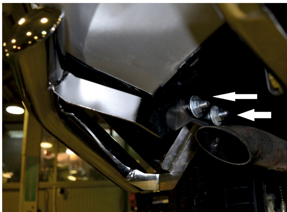
Рис. 3 - Установка уголков

Перед установкой изделия необходимо убедиться, что автомобиль, на который планируется установка, соответствует модельному ряду, указанному в настоящей инструкции. В случае затруднений с определением соответствия обращайтесь службу технической поддержки supp@rivalauto.com . В случае наезда на препятствие необходимо убедиться в отсутствии повреждений и агрегатов автомобиля и пригодности дальнейшей эксплуатации защиты. При правильной установке защита не должна касаться узлов и агрегатов автомобиля. Производитель вправе вносить изменения в конструкцию защиты.