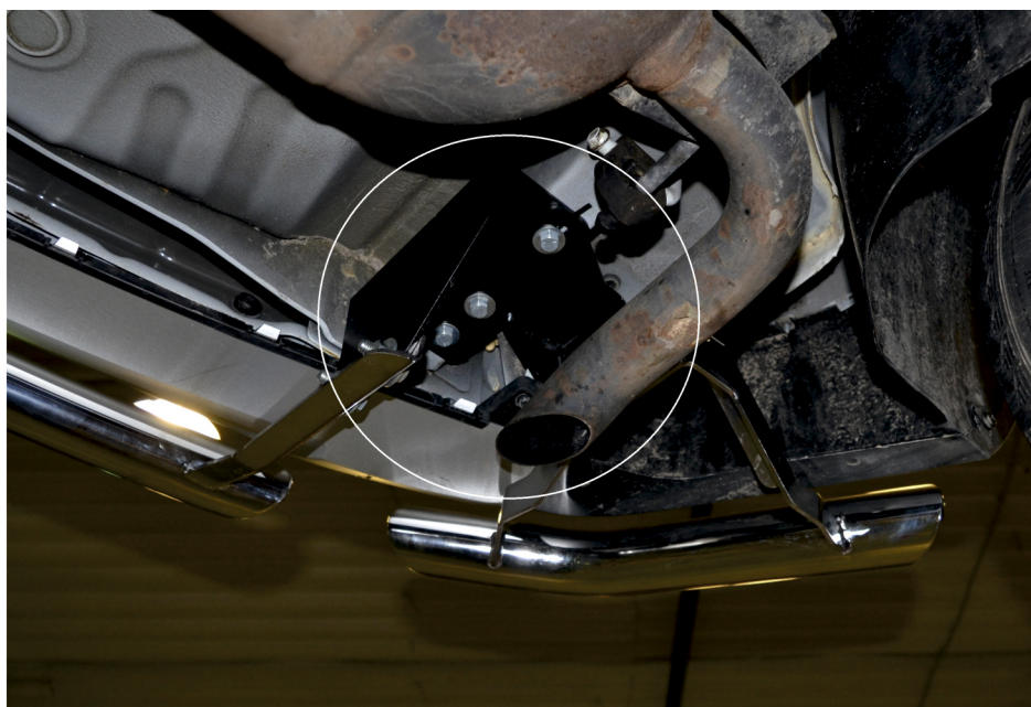
Рис. 5 - Совместная установка уголков R.3305.005 и защиты R.3305.007

Перед установкой изделия необходимо убедиться, что автомобиль, на который планируется установка, соответствует модельному ряду, указанному в настоящей инструкции. В случае затруднений с определением соответствия обращайтесь службу технической поддержки supp@rivalauto.com . В случае наезда на препятствие необходимо убедиться в отсутствии повреждений и агрегатов автомобиля и пригодности дальнейшей эксплуатации защиты. При правильной установке защита не должна касаться узлов и агрегатов автомобиля. Производитель вправе вносить изменения в конструкцию защиты.