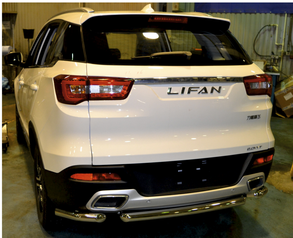
Рис. 4 - Общий вид автомобиля с защитой