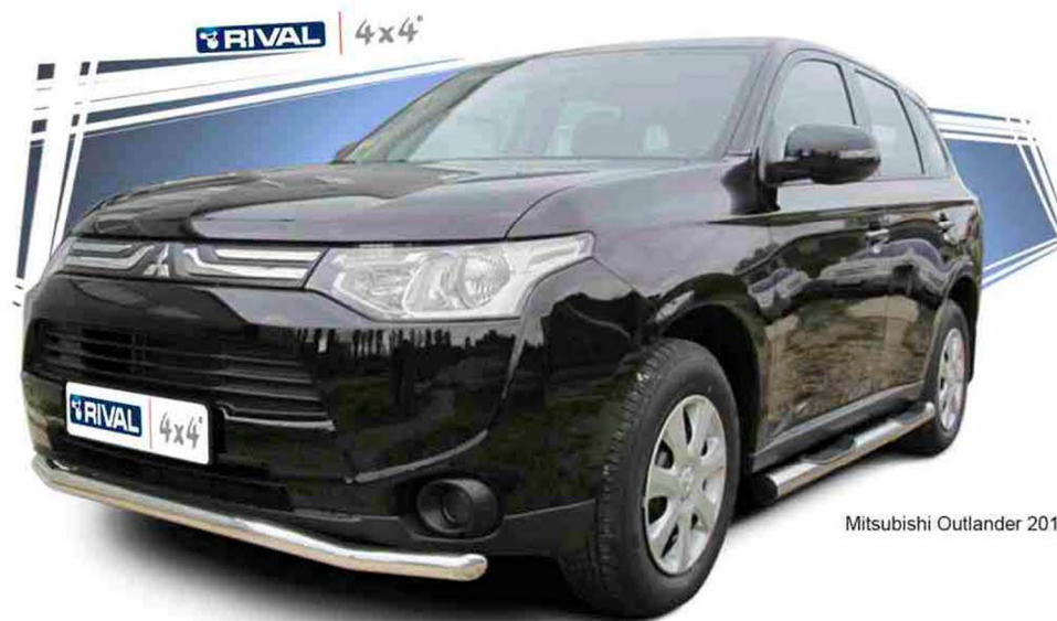
Mitsubishi Outlander 2012