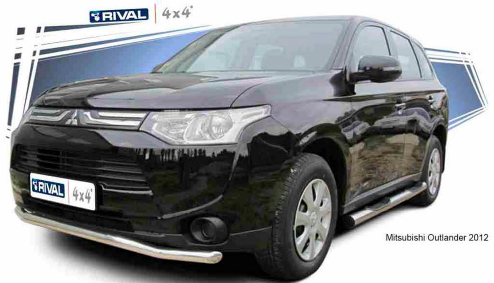
Mitsubishi Outlander 2012