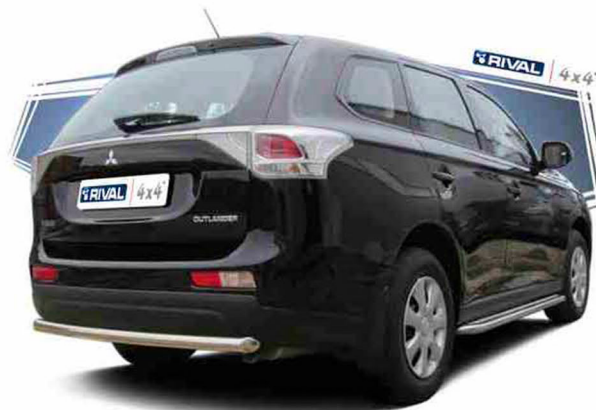
Mitsubishi Outlander 2012