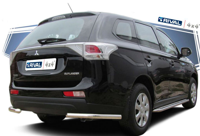
Mitsubishi Outlander '2012