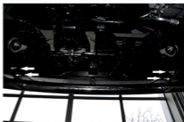
Рис. 2 - Установка защиты