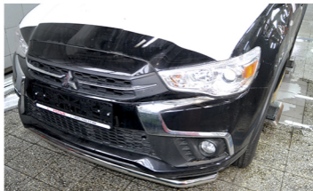
Рис. 3 - Общий вид автомобиля с защитой