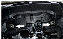
Рис. 1 - Установка кронштейнов