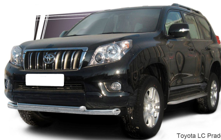
Toyota LC Prado