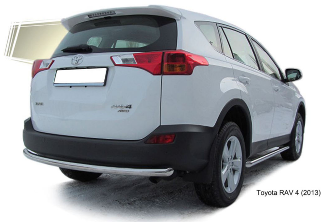
Toyota RAV 4 (2013)