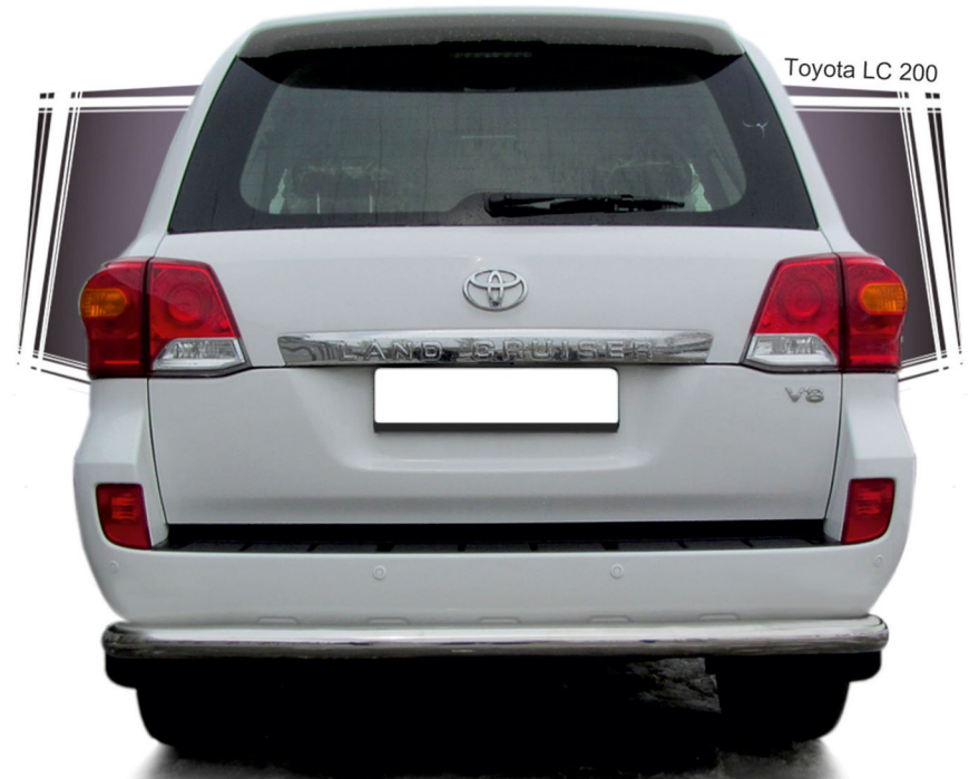
Toyota LC 200