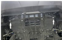
Рис. 1 - Установка фиксируемых гаек