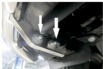
Рис. 3 - Установка защиты