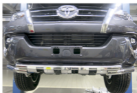
Рис. 4 - Общий вид автомобиля с защитой