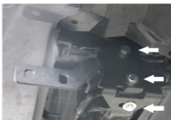
Рис. 2 - Установка кронштейнов