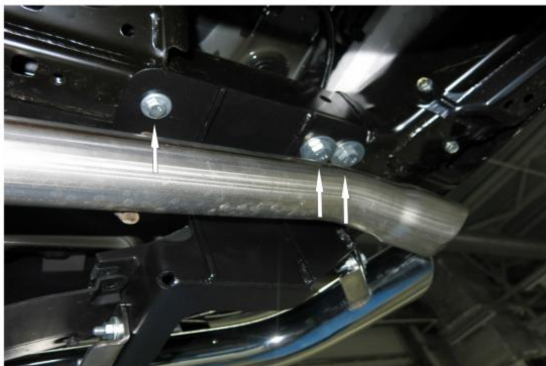
Рис. 2 Установка правого кронштейна