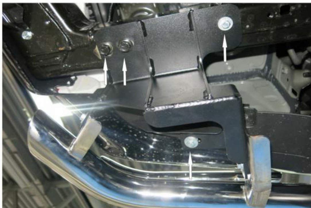
Рис. 1 Установка левого кронштейна